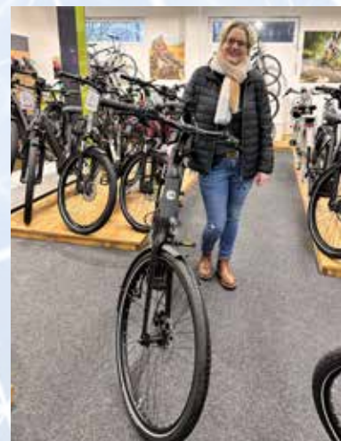
Die Gewinner freuen sich über neue E-Bikes.

Der Gewerbeverein der Gewerbetreibenden in Wiesmoor e.V. hat die Verlosung mit Hilfe der Freiwilligen Feuerwehr Wiesmoor durchgeführt. Für die tolle Zusammenarbeit und das Verkaufen aller 20.000 Lose bedankte sich der Verein bei der Feuerwehr. Der Überschuss dieser Weihnachtsverlosung kommt der Jugendabteilung der Feuerwehr zu Gute.