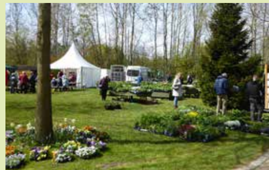
Das Wiesmoorer Blumenreich ist auch in diesem Jahr das Zentrum der Landpartie.

Stadtmarketing Stadt Wiesmoor, ute.rittmeier@wiesmoor.de, 04944-305-102