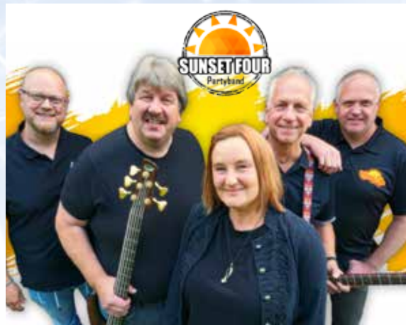
Die Band Sunset Four wird für Stimmung auf dem Stadtball sorgen. Agenturfoto Sunset Four

Wir danken allen Sponsoren! Das Stadtball-Team