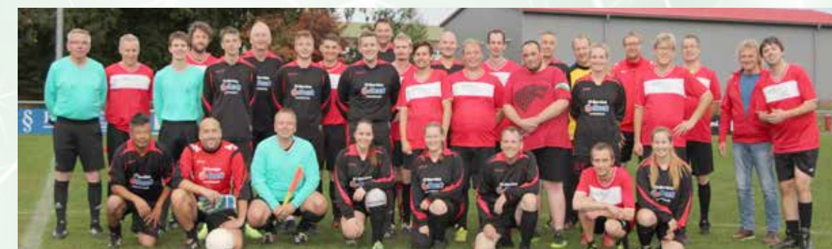
Die Teams der WfBM und des VfB.

Der VfB sagt vielen Dank für einen tollen Abend und freut sich schon jetzt auf das nächste Aufeinandertreffen.