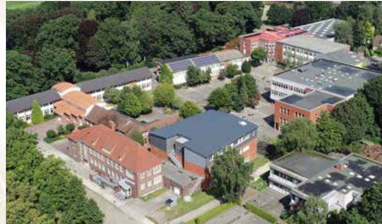
Es ist schon beeindruckend, was aus der kleinen Schule in Wiesmoor-Mitte seit 1913 geworden ist. Unser Bild zeigt den gesamten Komplex der KGS, unten rechts die Grundschule Wiesmoor-Mitte. Es wurde dem Buch „Wiesmoor 1922-2022“ entnommen.

HS-Abschluss nach 10, RS-Abschluss nach 10 und Erweiterter RS-Abschluss nach 10. Neu: Mit dem Erweiterten Sek I-Abschluss erlangten unsere Schüler*innen die Berechtigung zum Besuch einer beliebigen Gymnasialen Oberstufe. Die Übergänge wurden durchlässiger. Das brachte neue Bildungschancen, besonders für Spätentwickler.