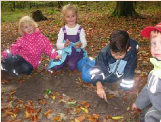
Im Hopelser Wald.

Jeden Dienstag sind die Wiesmoorer Tiddeltopp-Kinder in der Umgebung der Stadt unterwegs. Mal erforschen wir den Hopelser Wald oder wandern zur Freilichtbühne. Es gibt viele schöne Plätze, die die Kinder so kennen lernen. Besonders rund ums Ottermeer gibt es viel zu entdecken! Es zeigte sich schon eine dünne Eisschicht.