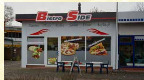
Das Bistro Side an der Hauptstraße.

S eit Anfang November betreiben Alexandra und Murat Samancioglu das Bistro Side in Wiesmoor, an der Hauptstraße 166. Zu allen Öffnungszeiten wird das Bistro gern besucht, um richtig lecker einen Döner Kebab zu essen. Die gute Mischung macht's und davon verstehen die Inhaber etwas. Wohl abgestimmt sind Fleisch, Salat und gute Gewürze, die pikante Sauce und dazu auf Wunsch kleingeschnittene Zwiebeln – so richtig lecker im Geschmack serviert im Pidebrot! Es werden auch weitere Spezialitäten der türkischen Küche angeboten, die immer nach Kundenwunsch zusammengestellt werden können, dazu gehören zum Beispiel Dürüm, Rollo, Salate, Aufläufe und Pizza.