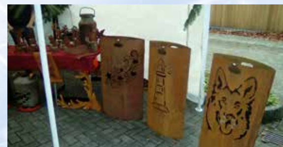
Dekoratives auf dem Weihnachtsmarkt der Dorfgemeinschaft Wilhelmsfehn I.