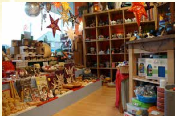
Der Bioladen „Biobunt“ bietet den Kunden ein vielfältiges Angebot.

der „Fairen Produktion“ und nachhaltigen Materialien, komplett mit LED ausgestattet, Goldlichter mit echtem Blattgold, Sterne in verschiedenen Größen sowie Naturkosmetik usw.. Leckeres Weihnachtsgebäck, Glühweine und alkoholfreie Punsche gehören zum Sortiment und auf Wunsch können auch weihnachtlich gestaltete Präsentkörbe zusammengestellt werden.