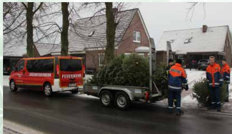
Alle Jahre wieder... die Jugendfeuerwehr sammelt die Weihnachtsbäume ein.