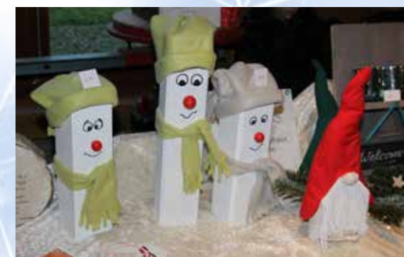
Dekoratives für die Winterzeit.