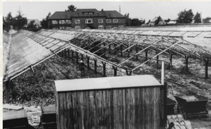
Abbruch der Frühgemüse-gärtnerei.

Absicherung · Wohneigentum · Risikoschutz · Vermögensbildung