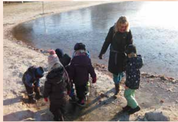
Der Kindergarten Tiddeltopp auf Erlebnistour am Ottermeer.