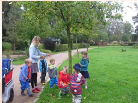
Wanderung zur Freilichtbühne.

Jeden Dienstag sind die Wiesmoorer Tiddeltopp-Kinder in der Umgebung der Stadt unterwegs. Mal erforschen wir den Hopelser Wald oder wandern zur Freilichtbühne. Es gibt viele schöne Plätze, die die Kinder so kennen lernen. Besonders rund ums Ottermeer gibt es viel zu entdecken! Es zeigte sich schon eine dünne Eisschicht.