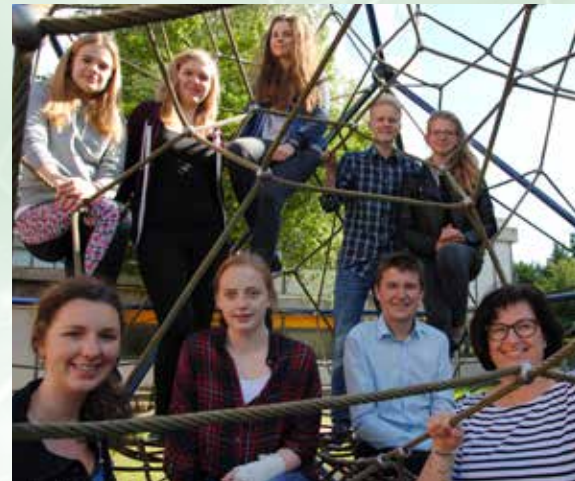
Die Jugendgruppe hat viel Spaß beim plattdeutschen Theaterspielen.

zender der Niederdeutschen Bühne, dem Stadtmagazin mit. Die Aufführungen im Forum der KGS (Schulstraße), die am Freitag, 12. Januar, und Samstag, 13. Januar, um 20 Uhr beginnen werden, halten für das Publikum aber noch mehr bereit. Die „Großen“ der Theatergruppe werden zudem Sketche präsentieren, die zum Schmunzeln anregen. Das gleiche Theaterprogramm wird auch am Sonntag, 14. Januar, um 15 Uhr gezeigt. Karten dafür sind ausschließlich an den jeweiligen Tages- und Abendkassen erhältlich, die eine Stunde vor Veranstaltungsbeginn geöffnet haben werden.