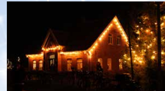
Am 1. und 3. Advent findet wieder der Wiesmoorer Weihnachtsmarkt beim Torf- und Siedlungsmuseum statt.

Viele Besucher kommen auch von außerhalb, die von dem Ambiente begeistert sind. Viele Aussteller vom vergangenen Jahr haben ihr Kommen wieder zugesagt. Die Besucher erwartet eine Vielfalt von Deko- und Geschenkartikeln. Nicht zu vergessen das kulinarische Angebot. Ob Bratwurst oder Wild, ob Wein oder Feuerzangenbowle, für jeden Geschmack ist etwas dabei. In der gemütlichen Teestube kann man Tee trinken und dazu Rosinenbrot oder Neujahrskuchen essen. Die Organisato-