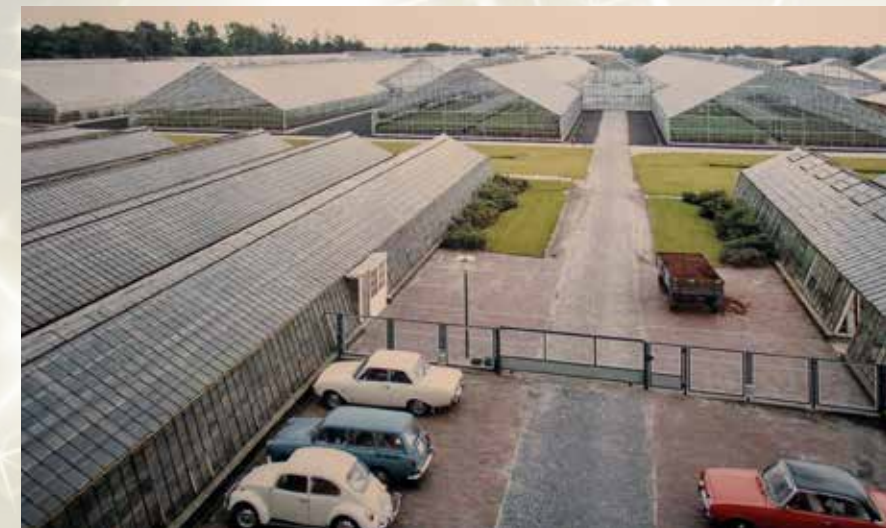
Wiesmoor-Gärtnerei, Blick vom Torhaus.