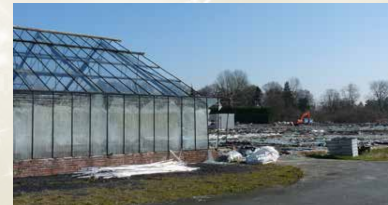
Abriss der Gewächshäuser.