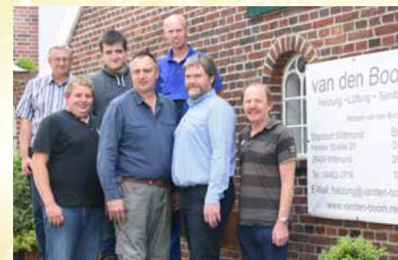
Lösen Probleme in den Bereichen Sanitär, Heizung und Klima – die Mitarbeiter der Firma van den Boom.

e-mail: heizung@vanden-boom.net www.vanden-boom.net