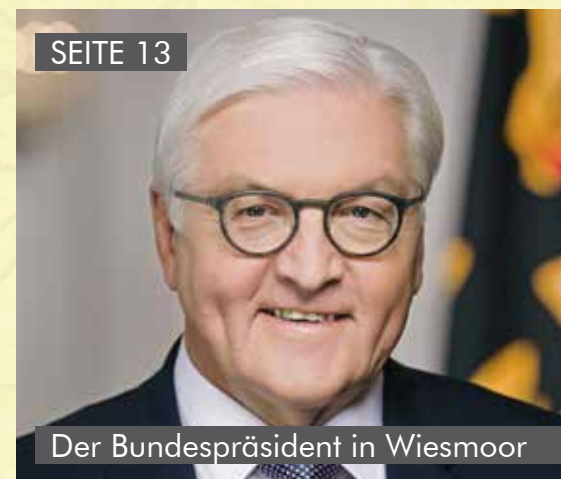
Der Bundespräsident in Wiesmoor