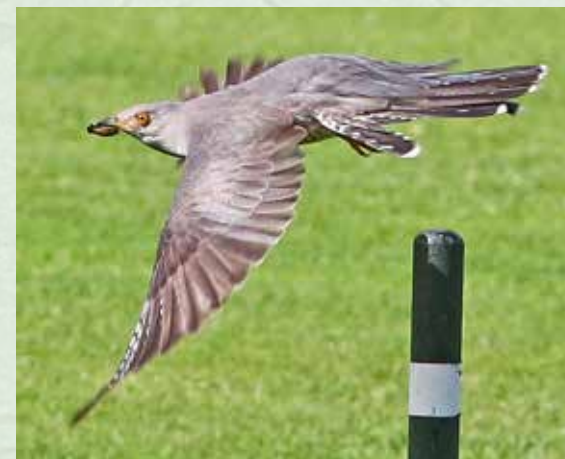
Kuckuck im Flug

Unsere Reihe der Tierfotos von Manfred Helmerichs aus Wiesmoor setzen wir heute mit einem Foto vom Kuckuck fort.