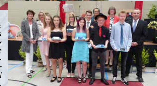
Rechts: Mitglieder des Förderkreises ehren die Jahrgangsbesten der Haupt- und Realschule.