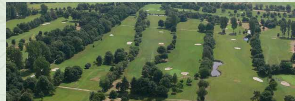
Das Golfplatzgelände ist nicht nur für Golfspieler interessant, sondern auch viele Wanderer und Fahrradfahrer wissen das Areal zu schätzen. Luftaufnahme aus dem Jahr 2008.

messen können, sogar über die Geschlechtergrenzen hinaus. Die Entwicklung spricht für sich, rund 650.000 Menschen spielen bereits auf 724 Golfanlagen deutschlandweit – mit steigender Tendenz. Der Golfclub Ostfriesland e.V. existiert schon über 30 Jahre. Im Jahre 1983, also vor über 34 Jahren wurde in Wiesmoor – Hinrichsfehn der erste Ball geschlagen und der ursprüngliche 18-Loch Golfplatz eröffnet. Nach einer Erweiterung im Jahre 2005 steht den Golfern nun eine 27-Loch-Anlage für ihren Freizeitsport zur Verfügung. Der Platz ist geprägt von der Natur der Moorlandschaft, von Wasser und den unzähligen Rhododendren, die besonders zur Blüte im Mai/Juni die Runde Golf zu einem unvergesslichen Erlebnis machen. Wer am 20. August keine Zeit hat, kann sich auch zu einem der regelmäßig angebotenen Golfschnupperkurse anmelden. Weitere Informationen unter: www.golfclub-ostfriesland.de