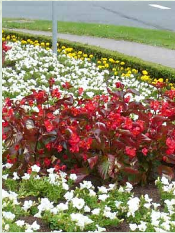
Ein besonderer Blickfang: Die neue Anpflanzung am Ehrenmal mit der BIG-Begonie.

Die aus Erfurt stammende Firma Benary hat zusammen mit der NWK nach der Währungsreform 1948 die Wiesmoor-Benary gegründet. Unternehmensziel war und ist die