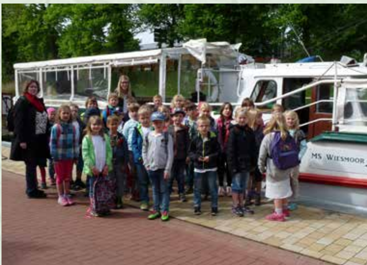
Unser Foto zeigt die Gruppe vor der „MS Wiesmoor“ am Liegeplatz im Nordgeorgsfehnkanal.

Verschiedene Wiesmoorer Bürger gründeten den Förderverein „MS Moornixe“, um die Kanalschifffahrt wieder zu beleben. Der Verein wollte die Moornixe von den bisherigen Eignern kaufen. Der geforderte Kaufpreis überstieg das vorhandene Budget des Fördervereins jedoch ganz erheblich. Zum Glück wurde dem Verein ein Schiff, die „MS Marion“, die bisher in Ihlow und um zu unterwegs war, angeboten. Bei einem deutlich günstigeren Kaufpreis wurde der Verein schnell handelseinig. Der Name „Moornixe“ stand noch im Schiffsregister. Ein neuer Name musste