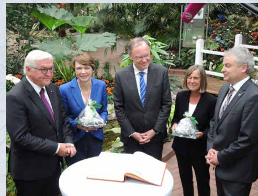
Eintrag ins Goldene Buch.