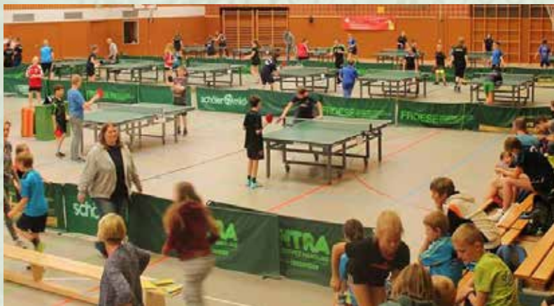
Die Wiesmoorer Dreifachturnhalle war gut mit Teilnehmern und Besuchern gefüllt.

Schon zum 30. Mal wurde die vierteilige Turnierserie für Kinder und Jugendliche von den ostfriesischen Vereinen durchgeführt. Die Austragungsorte sind Holtriem, Strackholt, Emden und Wiesmoor. Die Sichtungungsveranstaltung ist für Nachwuchsspieler eine Chance, sich mit den Spielern aus der jeweiligen Altersklasse zu messen und in den Gruppenspielen sowie in der KO-Runde um den Tagessieg und um Punkte für den Gesamtsieg zu spielen. Am Sonntag, den 21. Mai fand schließlich das letzte und entscheidende Turnier in Wies-