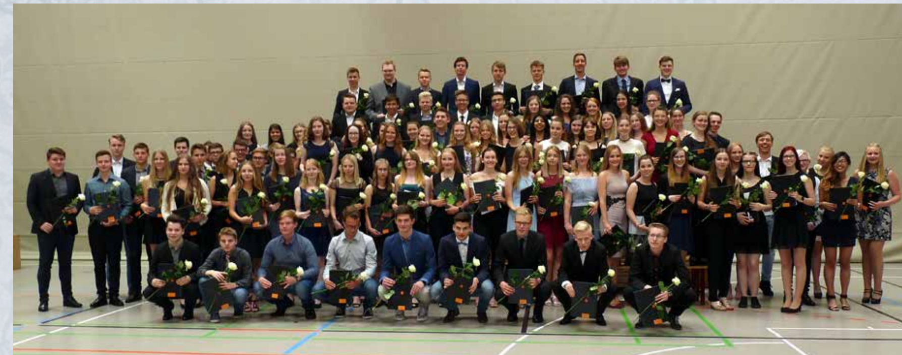
Der komplette Abiturjahrgang 2017.

Von bodenständig bis hochherrschaftlich – mit uns findet jede Immobilie den passenden Käufer.