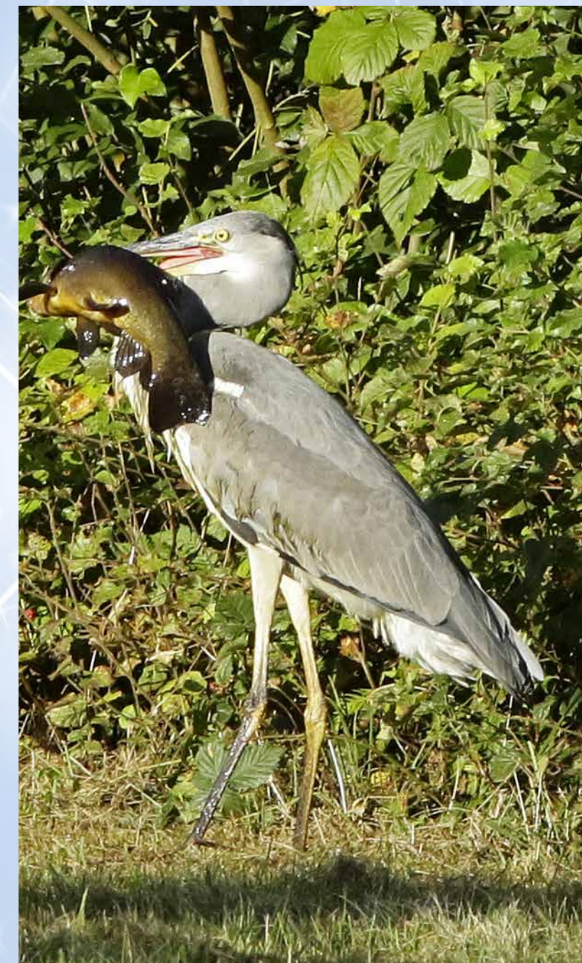
Ein besonderer Glücksmoment für den Fotografen: Dieser Graureiher hat aus dem Gewässer am Torf- und Siedlungsmuseum, in der Nähe der Torfschiffe, eine kapitale Schleie erbeutet.

Beginnend mit dieser Ausgabe werden wir unseren Lesern künftig seine Bilder zeigen.