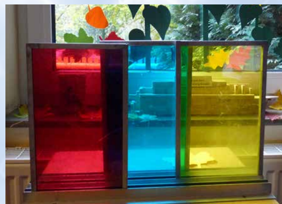
Ein sehr interessantes Projekt waren diese farbigen Glasscheiben. Aus den Körperfarben Rot, Blau und Gelb ließen sich durch Verschieben der Tafeln viele Farbmischungen darstellen. Es wird u.a. sichtbar, dass Blau und Gelb zusammen Grün ergibt.

In den letzten fünf Jahren arbeitete ich als Konrektorin in Wiefelstede. Die letzten 16 Jahre in Wiefelstede waren eine gute und lehrreiche Zeit.