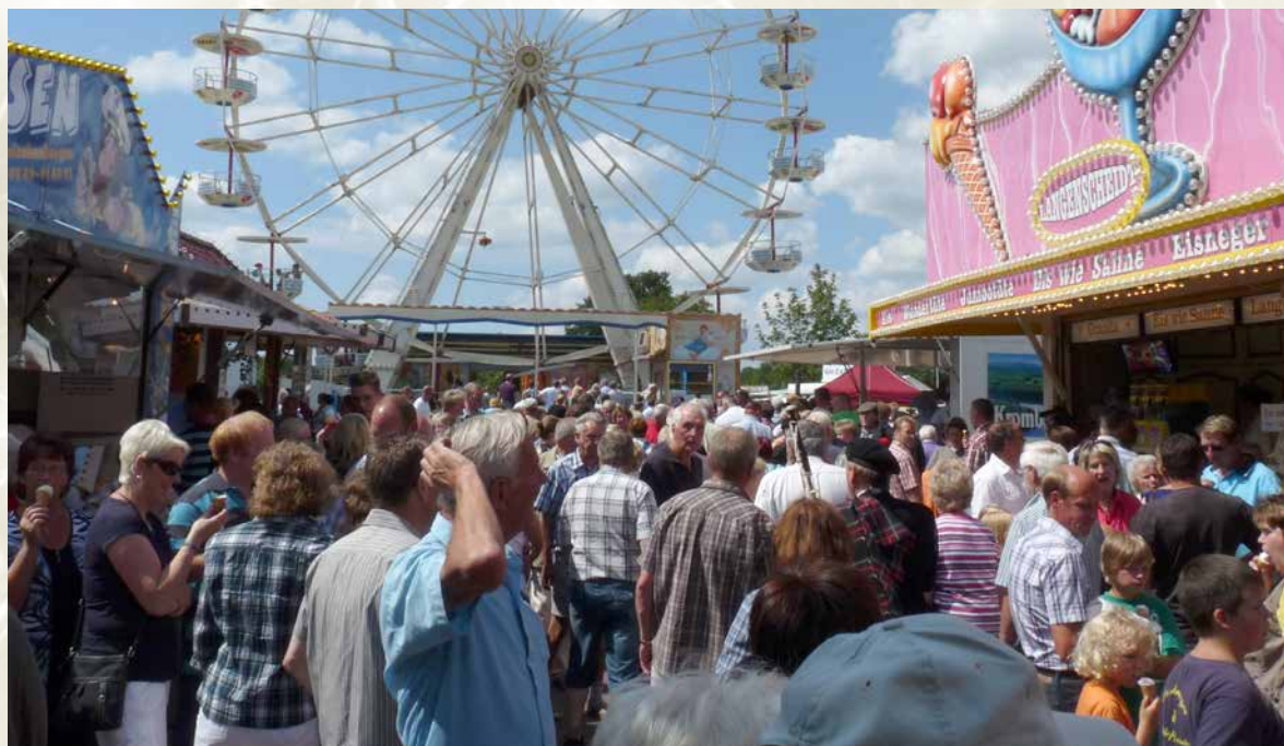
Jahrmarkttrubel auf dem Festgelände.

stück wurde aufgeführt, Volksmusiker wie die Wildecker Herzbuben traten auf, ein Ballonflug fand statt und als krönender Abschluss ein Festumzug bestehend aus Zwischenberger Vereinen und Vereinen aus der Nachbarschaft.