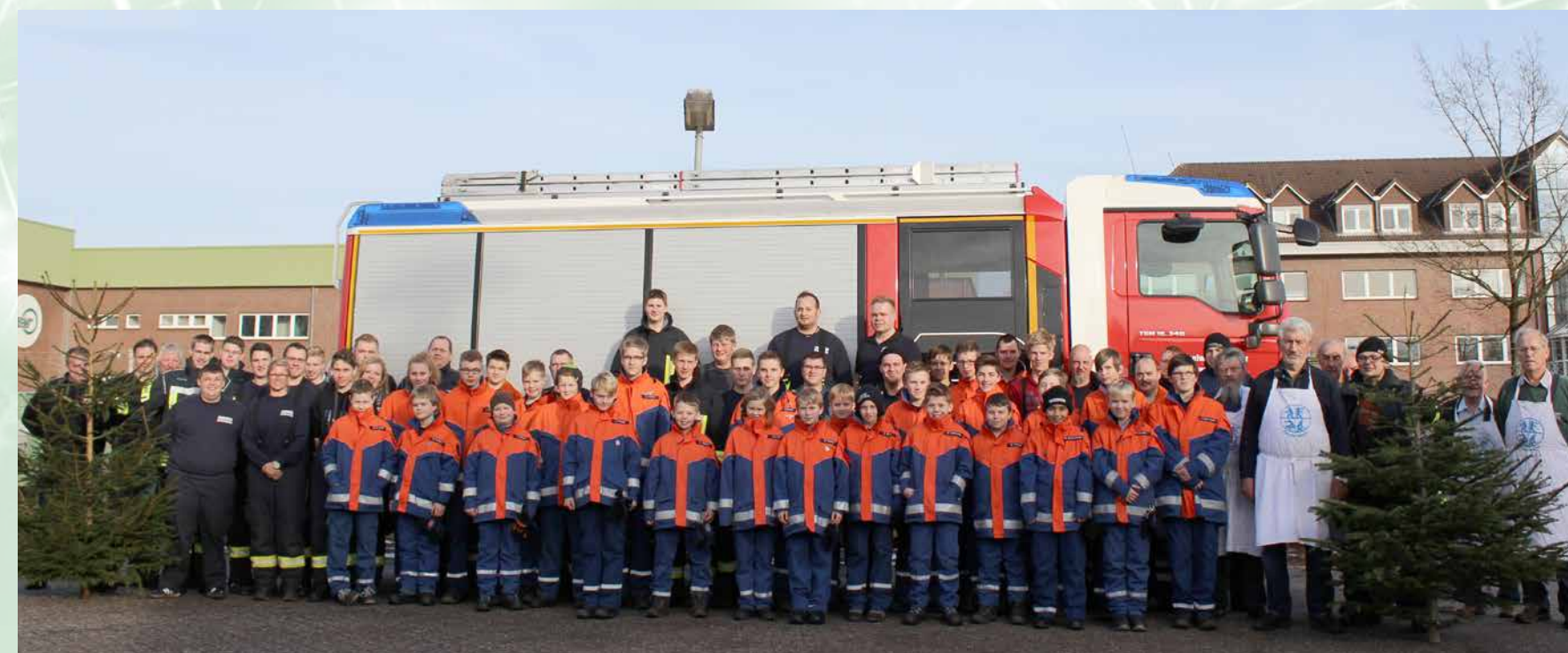
Die fleißigen Helfer der alljährlichen Weihnachtsbaum-Sammel-Aktion.