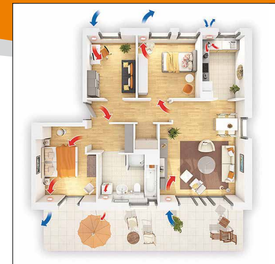
Funktionsprinzip, dezentrale Lüftung im Reversierbetrieb

Durch einen einfachen und unkomplizierten Einbau dezentraler Lüftungsanlagen – sowohl beim Neubau als auch bei Sanierungen – schaffen wir nicht nur eine angenehme Wohnatmosphäre, sondern reduzieren gleichzeitig Ihren Energieverbrauch. Dies erfolgt durch die Einsparung der erforderlichen Fensterlüftung. Das Herzstück unserer Lüftungsanlagen – der Keramikwärmespeicher – speichert die Wärme der