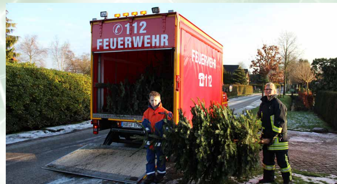
Mit einem strahlenden Lächeln verrichten die jungen Feuerwehrleute ihre Arbeit.

Die Vorbereitungen für die kommende Weihnachtsbaum-Aktion laufen bereits auf Hochtouren. Am Samstag, den 07. Januar 2017 findet die 23. Auflage der Aktion statt. Ab 09.00 Uhr sind die Sammeltrupps dann im gesamten Stadtgebiet inklusive aller Ortsteile unterwegs.