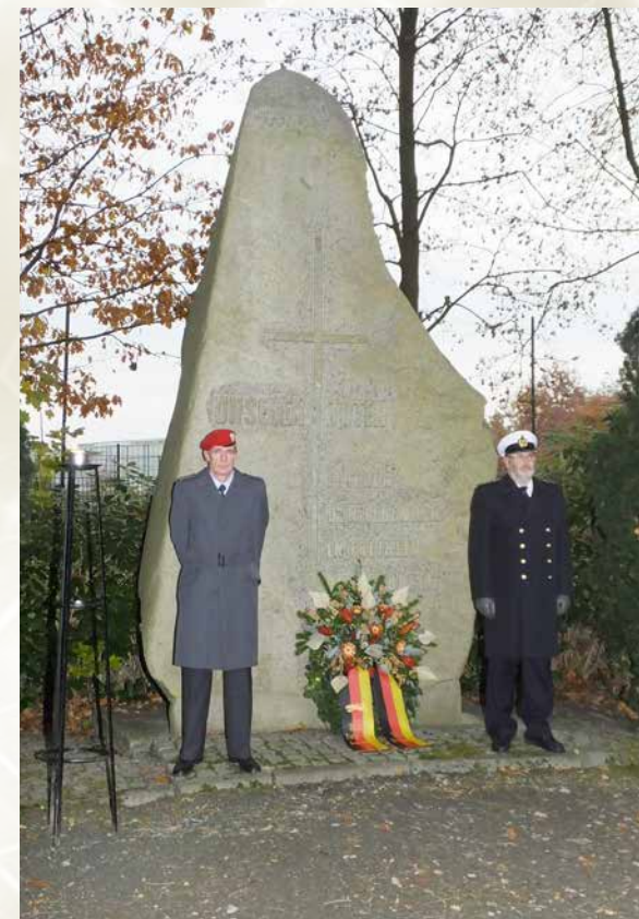
Eine Ehrenwache der Reservistenkameradschaft legte einen Kranz nieder.

ge nach dem Zweiten Weltkrieg. Albert Schweitzer sagte einmal: „Lassen Sie uns hoffen, dass Soldatenfriedhöfe endlich die großen Prediger des Friedens sein mögen, dann wird Versöhnung über den Gräbern möglich, dann kann Frieden beständig sein“. Im Anschluss wurde ein Kranz am Ehrenmal niedergelegt. Der Volkstrauertag ist in Deutschland ein staatlicher Gedenktag und gehört zu den „stillen Tagen“. Seit 1952 wird der Volkstrauertag zwei Sonntage vor dem ersten Adventssonntag begangen. Im Mittelpunkt steht das Gedenken an die Kriegstoten der beiden Weltkriege. Darüber hinaus gedenkt man den Opfern von Gewaltherrschaft, Krieg, Terrorismus, und politische Verfolgung aller Nationen. Dieser Gedenktag wurde bereits 1919 vom „Volksbund Deutsche Kriegsgräberfürsorge“ für die gefallenen deutschen Soldaten des Ersten Weltkrieges vorgeschlagen. Der Volkstrauertag ist kein kirchlicher Feiertag. Dennoch erinnert die Kirche im Rahmen einer