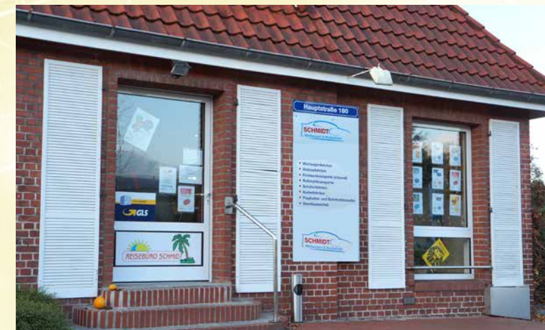
Die Geschäftsräume an der Hauptstraße 180.