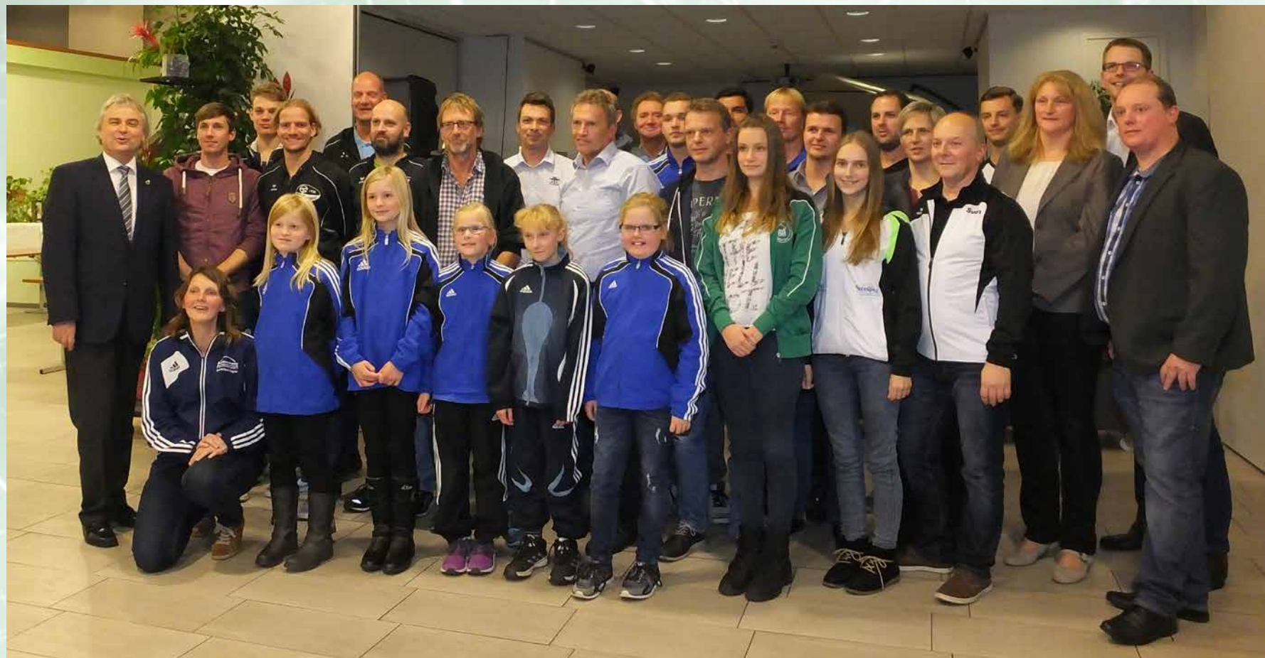
Bürgermeister Friedrich Völler gemeinsam mit den 34 Sportlerinnen und Sportler in der Blumenhalle.