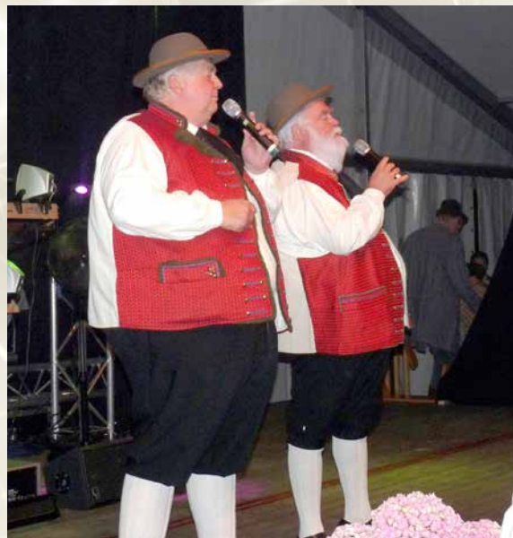
Die „Wildecker Herzbuben“ zu Gast auf dem Jubiläumsfest.