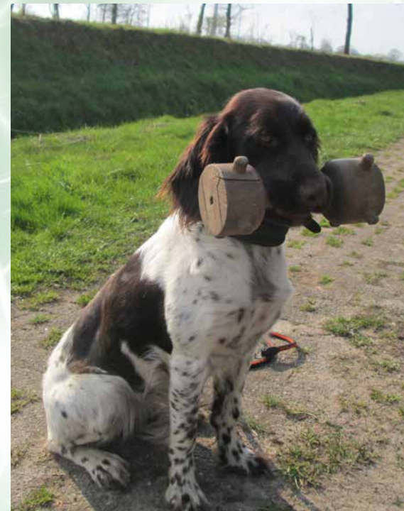
Mit dem „Kleinen Münsterländer“ wird gerade das Apportieren geübt.

Nach (und während) der Prägephase beginnt die eigentliche Ausbildung. Man bringt dem Hund bei, an der Leine zu gehen – das dauert oft viele Wochen – oder legt ihn ab, entfernt sich erst einige Schritte, dann einige Meter und geht schließlich außer Sichtweite, ohne dass der Hund seinen Platz verlässt. Der kleine Hund kann schon jetzt ebenfalls lernen, auf Pfiff zum Menschen zu kommen und sich ohne Befehl nicht von ihm zu entfernen.