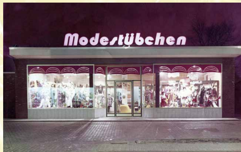
So fing 1973 es an: Die angemieteten Geschäftsräume an der Hauptstraße.