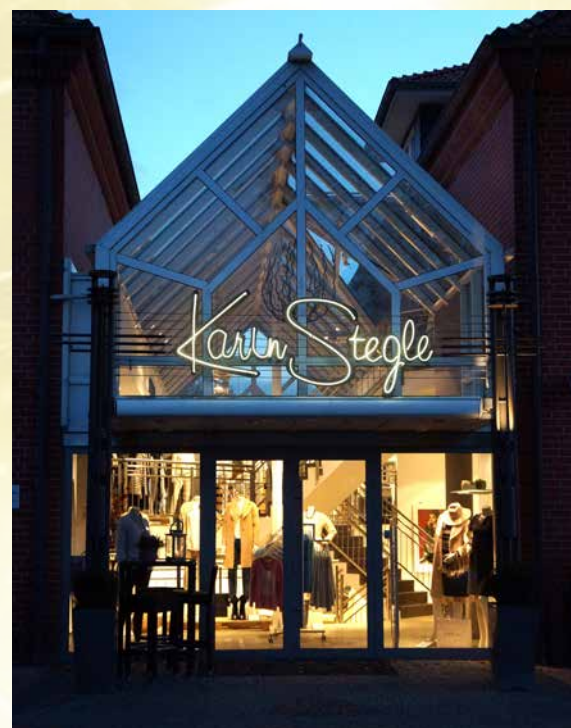
Das Modehaus Stegle am Marktplatz in abendlicher Stimmung.