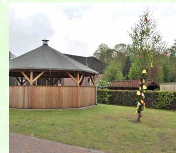
Der Maibaum am Dörp-Platz