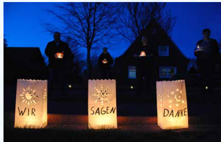
Mit einer großen Kerzenaktion zu Ostern wurde in Wiesederfehn die Dankbarkeit zum Ausdruck gebracht.

„Vermissen Euch“ oder „Liebe Grüße“ sind nur zwei von vielen Grußbotschaften, die die Kinder der Kindertagesstätte „Mullbarger Nüst“ in Mullberg in unterschiedlicher Form