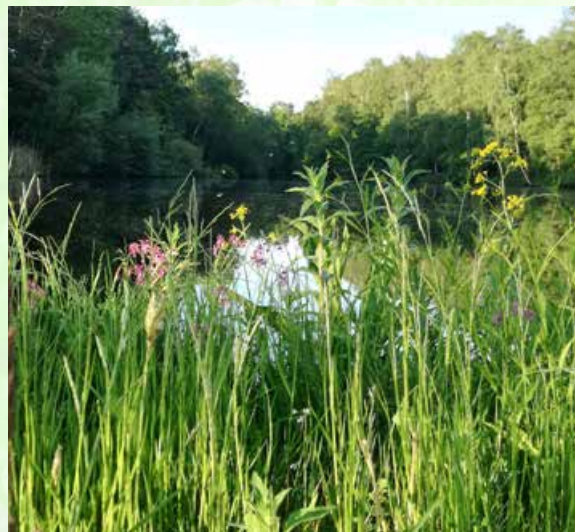
Am Wildbach an der Freilichtbühnenstraße.