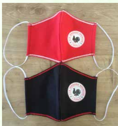
Mund- und Nasenschutz mit Vereins- emblem