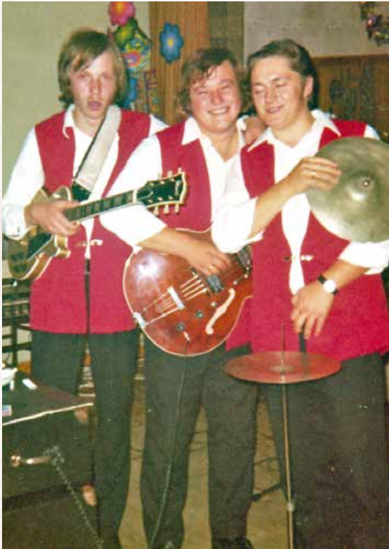
Die Musketiere sorgten für Stimmung