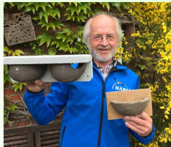
Einzelnest für Rauchschnalben und Doppelnest für Mehlschnalben

weißen Fleck auf dem Rücken – Mehlsack) vorwiegend an der Außenseite von Gebäuden, oft in Kolonien, ihr Nest baut. Früher entnahmen Schnalben das Nistmaterial den Pfützen an der Straße oder vom Feldrand. Heute sind Straßen asphaltiert oder gepflastert. Die gefundene Erde ist häufig nicht lehmhaltig und damit stabil genug und das Nest bricht durch das Gewicht der Jungen weg. Die Brut ist verloren. Ein weiterer Grund für den starken Rückgang der Schnalben ist die knappe Nahrung. Wo früher z.B. noch Fliegen in kleinen Ställen reichlich vorhanden waren, sind heute häufig nur noch gekachelte Wände in großen Ställen zu finden. Der Mist wird fortgeschwemmt und die Fliegen nicht von Schnalben gefressen, sondern chemisch entfernt. Immer weniger Vieh auf den Weideflächen und viele öde Gärten ohne heimische Blumen und Sträucher verringern zusätzlich das Nahrungsangebot für die auf Fluginsekten angewiesenen Schnalben. Besonders schlimm wird es aber, wenn mühsam gebaute Nester von Men-