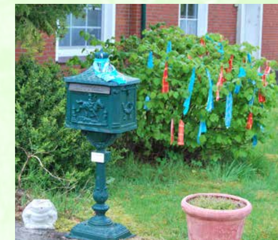
Klein aber fein in der Poststraße.