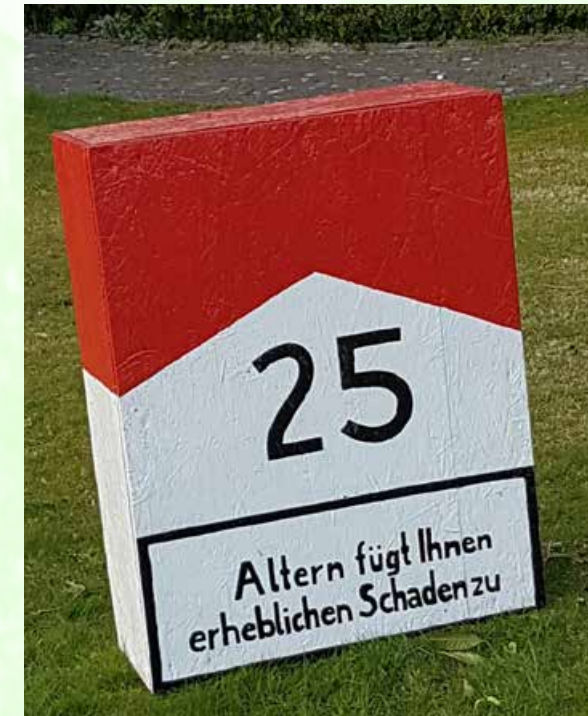
Gesehen in Hinrichsfehn zu einem 25. Geburtstag.