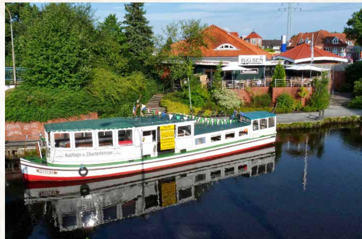
Der Liegeplatz war im Nordgeorgsfehnkanal, unterhalb vom Restaurant „Big Ben“.

in der Innenstadt. Sie sollte als Café-Schiff dienen. Das hat sich zerschlagen. Sie steht jetzt bei Ebay zum Verkauf.