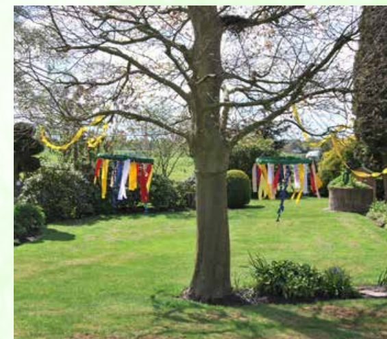
In der II. Reihe wurde nachhaltig geschmückt

Wer mag, kann sich das Ergebnis im Internet in Ruhe ansehen unter: http://marcardsmoor.de/wordpress/2020/05/01/maibaum-mal-anders-in-marcardsmoor-umsetzung-gelungen/