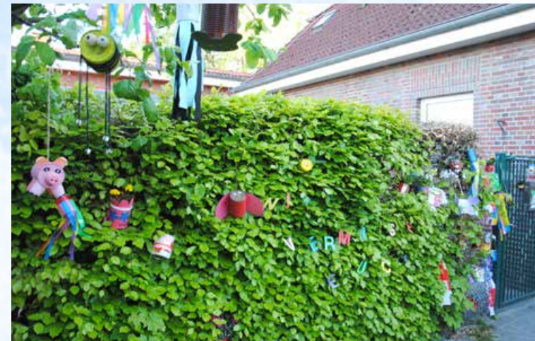
Am Zaun des Außengeländes der Kindertagesstätte in Mullberg wurden viele kleine und bunte Grußbotschaften hinterlassen.

am Zaun des Außengeländes hinterlassen haben. Mal auf einer bemalten und beklebten Dose, dann aus Moosgummi oder auch in Form von bunten Blumen. Aufgrund der