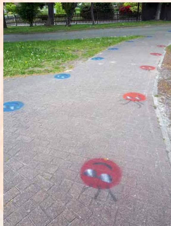
Kennzeichnung der Marschrichtung

Nach Ausbruch im chinesischen Wuhan im Dezember 2019 wurde die Corona-Epidemie anfangs nicht ausreichend eingegrenzt und unter Umständen auch von der chinesischen Staatsführung verheimlicht. Schnell breitete sich das Virus in ganz China aus. Das wurde begünstigt durch das chinesische Neujahrsfest, zu dem viele Arbeiter von ihren auswärtigen Arbeitsstellen in ihre Heimat reisten. So kam es zu einem rasanten