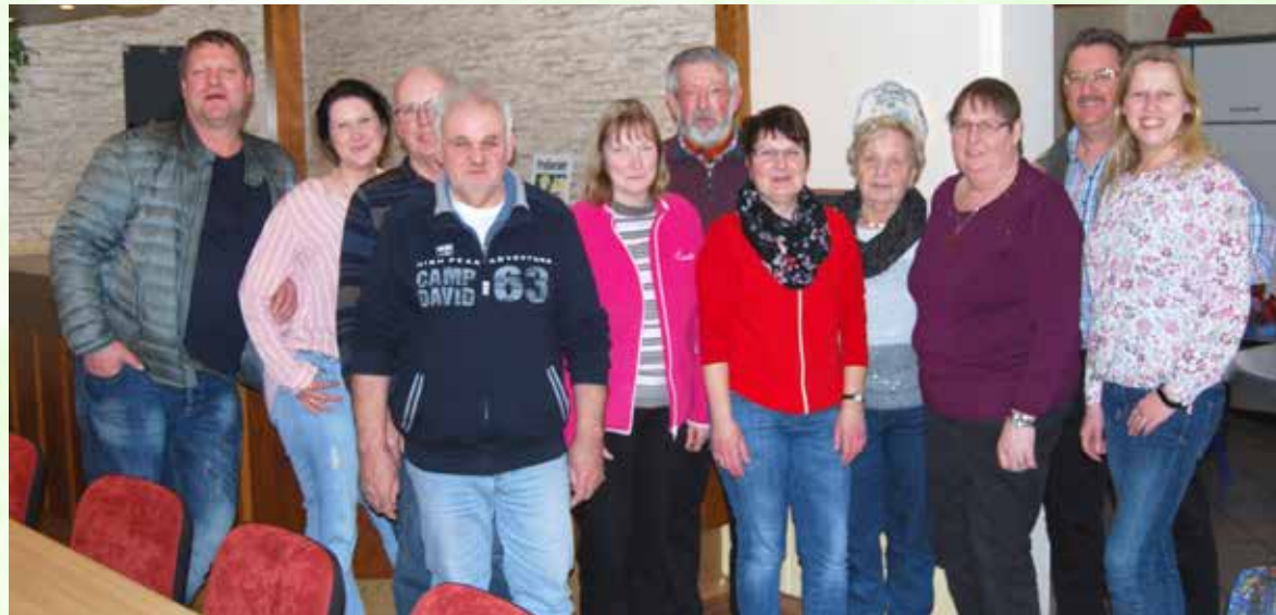
Ein Teil des Vorstandes der Dorfgemeinschaft Marcardsmoor.

Auch im neuen Jahr sind viele Veranstaltungen geplant. Schon das Grünkohlessen im Januar fand wieder viel Anklang. Eine Radtour ist am 16.05.2020 geplant, gemeinsam mit der Freiwilligen Feuerwehr, die in diesem Jahr Ausrichter der Tour ist. Die Dorfgemeinschaft wird sich im September wieder am Blütenfest beteiligen. Neue Events sind in Planung (Aufgrund der derzeitigen Situation sind Änderungen möglich). Neue Mitglieder sind immer herzlich willkommen.