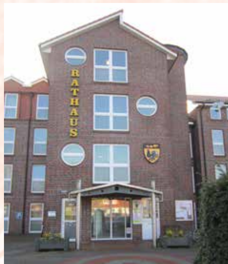
Die Mitarbeiter des Wiesmoorer Rathauses stellten sich vor. Jetzt endet die Artikel-Serie.

Irgendwann kommt der Zeitpunkt und eine Artikel-Serie geht zu Ende. In dieser Ausgabe von MEIN WIESMOOR ist es nun soweit. Nach 14 Geschichten beenden wir unsere Serie „Das Rathaus stellt sich vor“. Alles begann im Oktober 2017, also vor nunmehr zweieinhalb Jahren, als die 12. Ausgabe in die Postkästen flatterte. Damals schmückte ein herbstliches Motiv das Titelblatt. Unser Auftaktartikel befasste sich mit den Mitarbeitern im Einwohnermelde- und Gewerbeamt. Unter der Überschrift „Erste Anlaufstelle für die Bürger“ wurde über das vielseitige Aufgabengebiet, vom Beantragen eines Reisepasses bis zur Abmeldung eines Gewerbebetriebes, berichtet. In der darauffolgenden Ausgabe wa-