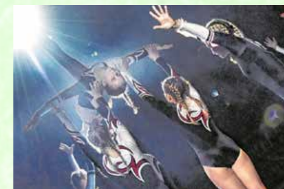
Die Mädchen TG zeigten ihr Können bei der Ostfriesischen Turnshow.

fizveranstaltung komplett ausverkauft. Die 9 – 18-jährigen Mädchen stellten ihre Bodenturnkür unter das Motto „Der König der Löwen“. Über Monate haben die Mädchen von der TG Wiesmoor für diesen Moment trainiert und wurden mit reichlich Applaus bedacht. Die Redaktion von „Mein Wiesmoor“ findet – ein tolle Leistung!