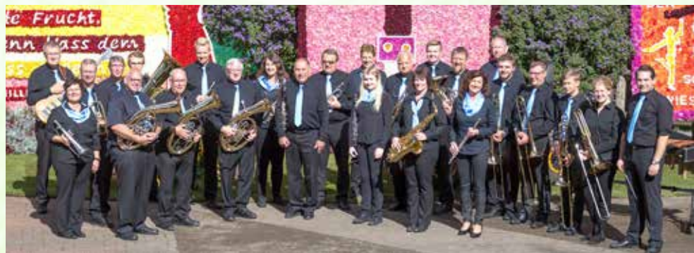
Das Stadtorchester sorgt immer für den musikalischen Rahmen bei der Wahl der Blütenkönigin.

seit vier Jahren der zweite Vorsitzende des Vereins. Interessierte Musiker und Musikerinnen aus allen Blasinstrumentengruppen und Schlagzeug sind dem Orchester jederzeit willkommen.