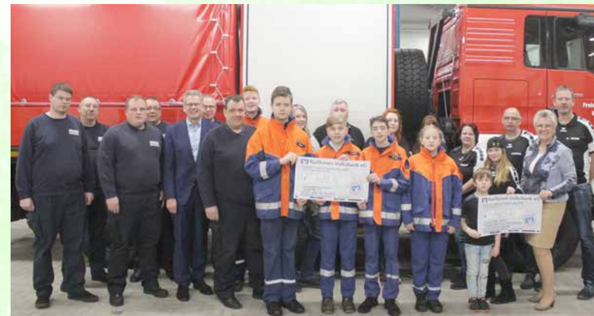
Freude über die stattliche Gewinnausschüttung.

A uch im letzten Jahr veranstaltete der Gewerbeverein Wiesmoor wieder die traditionelle und bekannte Weihnachtsverlosung. Der Golden Dart-Club Rispelerhelmt aus Marcardsmoor und die Feuerwehr Wiesmoor unterstützten dabei tatkräftig die Aktion. In der Vorweihnachtszeit brachten zahlreiche Helfe-