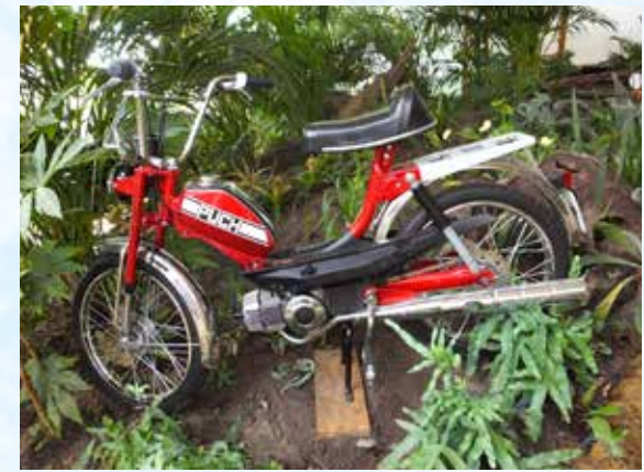
Die Fans der motorisierten Zweiräder konnten in Erinnerungen schwelgen und kamen auch in Sachen neuer Fahrzeuge nicht zu kurz.

gespendet werden, so die Veranstalter Silvia und Dieter Eilers.