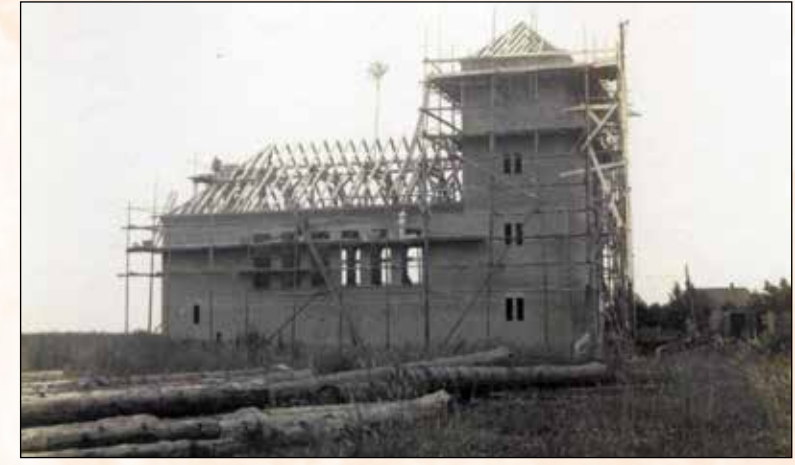
In einer sehr kurzen Zeitspanne des Jahres 1930 – von Ostern bis zum 1. Advent – wurde die Friedenskirche erbaut.