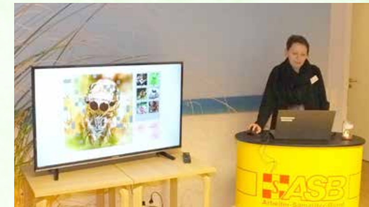
Die Quizshow ist sehr beliebt.

Eingerahmt wurde der informative Abend von einem Kunstmarkt hiesiger Künstler.