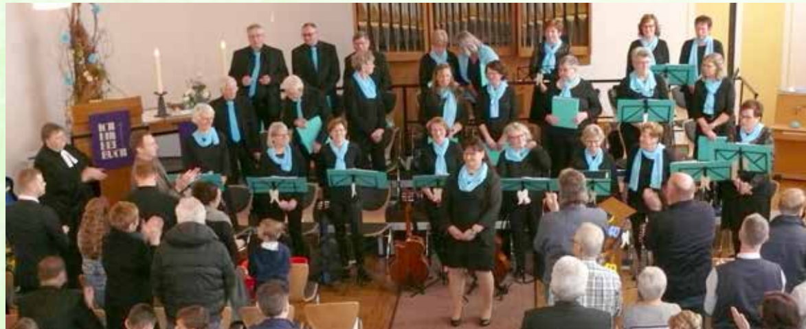
Das Publikum bedankte sich zum Schluss mit Standing Ovationen.

unter Begleitung von 12 Akustikgitarren. Gefeiert wurde das Jubiläum am Sonntag, dem 8. März 2020, während des Gottesdienstes in der Christuskirche zu Spetzerfehn. Zu dieser Kirchengemeinde zählen auch das Auricher Wiesmoor II und Wilhelmsfehn II – deshalb auch der Bericht im Stadtmagazin „Mein Wiesmoor“. Ein komplettes Konzertprogramm war ausgearbeitet und vorbereitet worden. Das Danken und Loben stand an diesem Vormittag im Vordergrund. Chormitglieder hielten alle Lesungen und sprachen Gebete. Auch wurde eine Chronik verlesen.