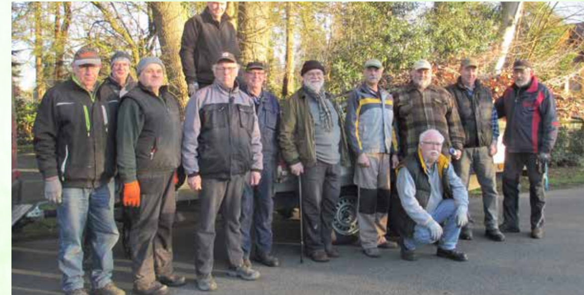
Arbeiten alle ehrenamtlich: Einige Mitglieder der Marcardsmoorer Dörpslüü.

und ihres ganzen Ortes. Viele Arbeiten werden das ganze Jahr ehrenamtlich übernommen, um Kosten zu sparen und trotzdem ein harmonisches Bild zu schaffen, wenn man sich in Marcardsmoor umsieht. Die Dörpslüü