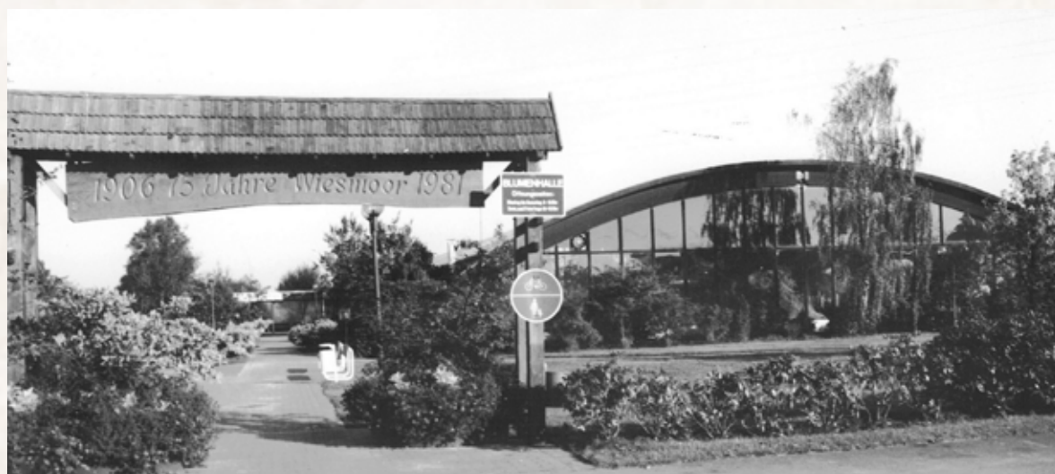
Die Blumenhalle im Jahr 1981.