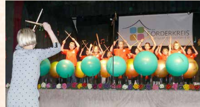
„Drums Alive“ mit der Grundschule Wiesmoor-Mitte.