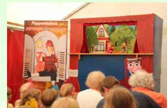
Viele Märchenerzähler/innen und Puppenspieler kommen gerne wieder zum Märchenfest.