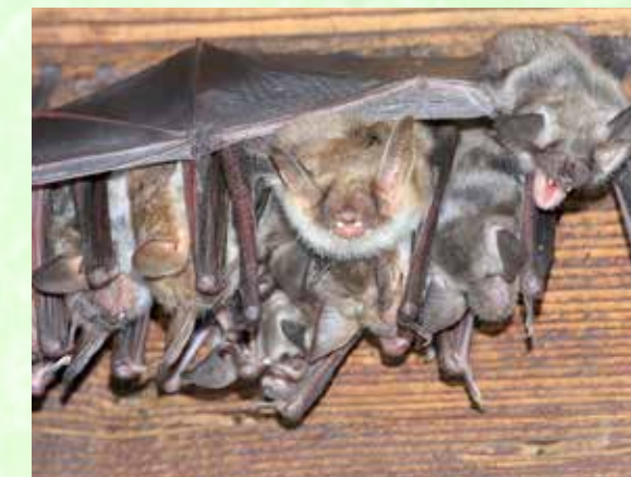
Fledermaus-Kolonie der Art „Großes Mausohr“.

Fledermäuse in Deutschland. Immerhin frisst eine Fledermaus in einer Nacht eine Insektenmenge bis zur Hälfte ihres eigenen Körpergewichtes. Bei z.B. einer Wasserfledermaus (in Wiesmoor derzeit noch heimisch) sind das bis zu 4000 Mücken pro Nacht. Massiver Einsatz von Spritzmitteln vergiftet ihre Nahrung, die Intensivierung der Landwirtschaft raubt ihre Lebensräume, öde Gärten mit Steinbeeten, ohne einheimische Blumen und Stauden, lassen lebensnotwendige Insekten und Schmetterlinge fehlen und unbedachte Bausanierungen versiegeln ihre Wohnstuben. Die NABU-Ortsgruppe Wiesmoor-Großefehn hat jetzt ein, von einem großzügigen Spender, überlassenes Transformatorhaus (Der Spender übernahm zusätzlich die Kosten für den Transport und das Aufstellen) zu einem sicheren Quartier für die bedrohten Fledermäuse umgebaut. Die Stadt Wiesmoor stellte zudem ein entsprechendes Grundstück zur Verfügung. Außer Einflugschlitzen wurde ein von den