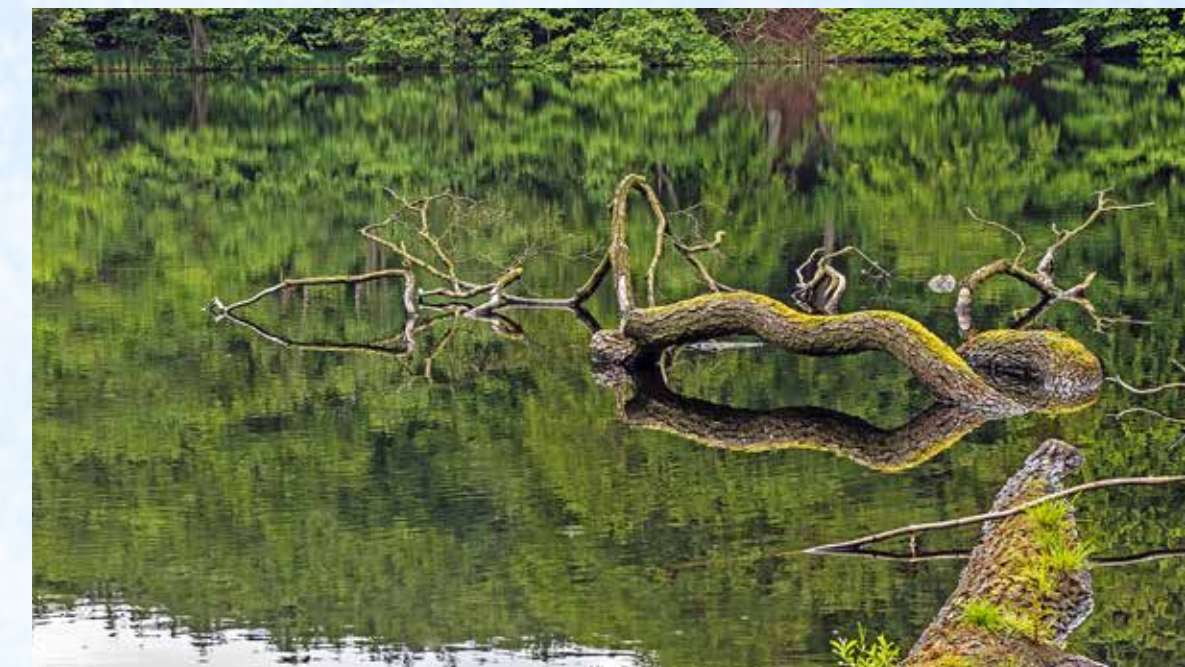
Kamera: Nikon D 5200, Blende F8, Brennweite 45 mm, Belichtungszeit 1/60 Sek.I. Das Monatsthema war diesmal „Spiegelungen“.

Veranstaltungen bitte per Mail an Kerstin.Klein@wiesmoor.de melden. Die Veröffentlichung ist kostenlos.