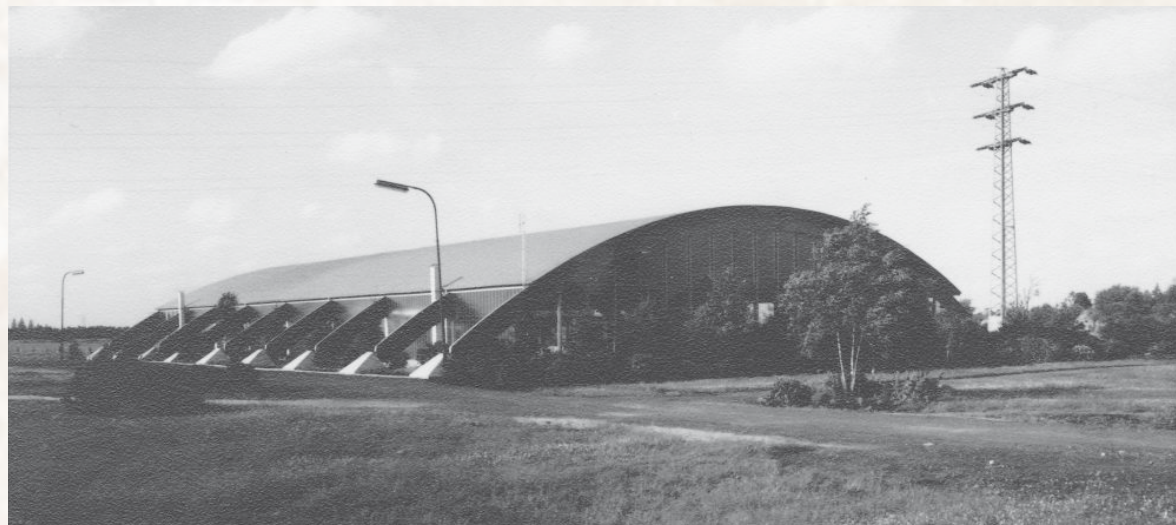
Eines der ersten Fotos zeigt die Blumenhalle 1969 nach der Fertigstellung.

Am 25. April 1969 erschien im Anzeiger für Harlingerland der Artikel, dass mit dem Bau der Mehrzweckhalle begonnen wer-