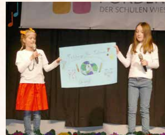
Friday for future.

Wiesmoor-Mitte wurde eine Zugabe verlangt. Die gab es dann im Rahmen der Zusammenkunft aller am Konzert beteiligten Schüler.