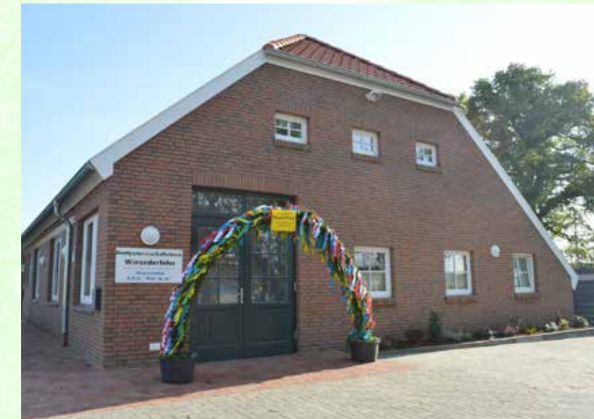
Das Dorfgemeinschaftshaus Wiesederfehne erstrahlt in neuem Glanz.

Maifeier. Am Dienstag, 30. April, wird gegen 18:30 wieder ein Maibaum aufgestellt. Alle Fehner und Gäste sind herzlich willkommen! Es werden Getränke angeboten und der Grill wird angeheizt. Die jungen Gäste können am offenen Feuer