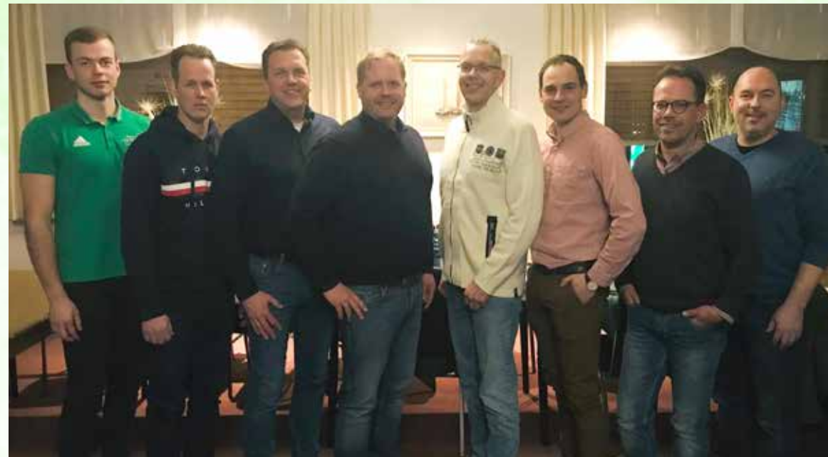
Der neue Vorstand des SVH