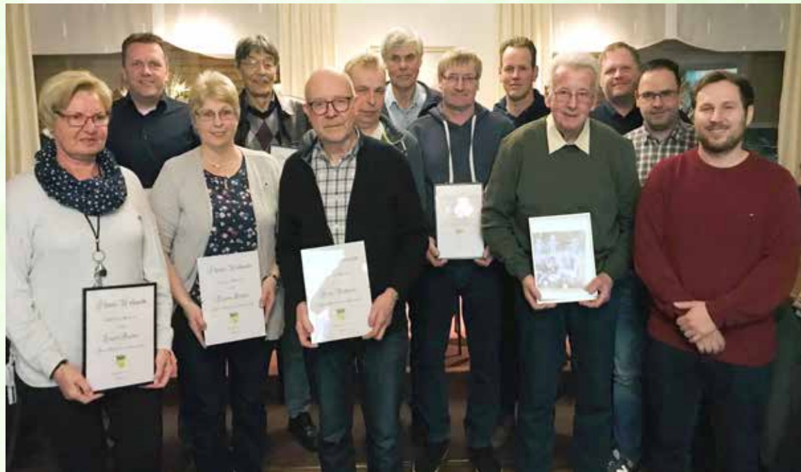
Ehrungen für treue und langjährige Mitgliedschaft im SV Hinrichsfehn.