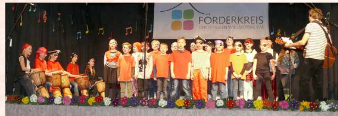
Die Grundschule am Fehnkanal (oberes Foto) und die Ottermeerschule (unten).