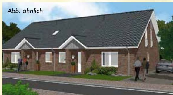
Geplante Doppelhäuser – Straßenansicht