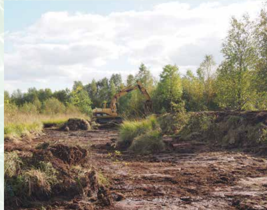
Am rechten Bildrand ist der neue Damm sichtbar.

gangenen Wochen nur vereinzelt geregnet hat, staut sich das Wasser wieder erstaunlich schnell hinter dem Damm. Bereits jetzt zeichnet sich der Erfolg der Aktion ab und die Naturschützer hoffen auf weitere ergiebige Regenmengen.