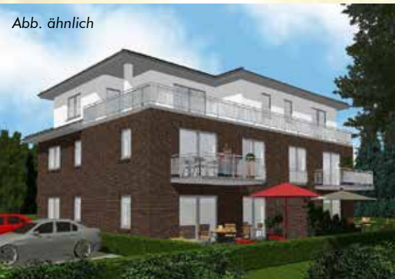
Mehrfamilienhaus mit Penthouse

Die Kaufpreise für die hochwertigen Eigentumswohnungen werden ab 186.500 € für die kleineren und ab 204.900 € für die größeren Wohnungen beziffert; bei den exklusiven Doppelhaushälften liegt der Kaufpreis ab 215.900 € bzw. ab 239.500 €, je nach Wohnfläche.