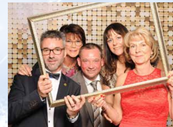
Ein erfahrenes Orga-Team...