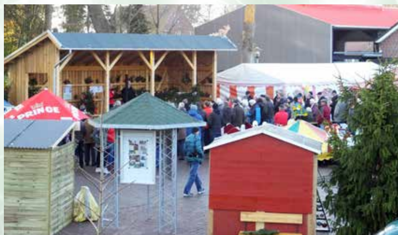
Gespannt verfolgen die Gäste das Geschehen auf der barrierefreien Bühne.