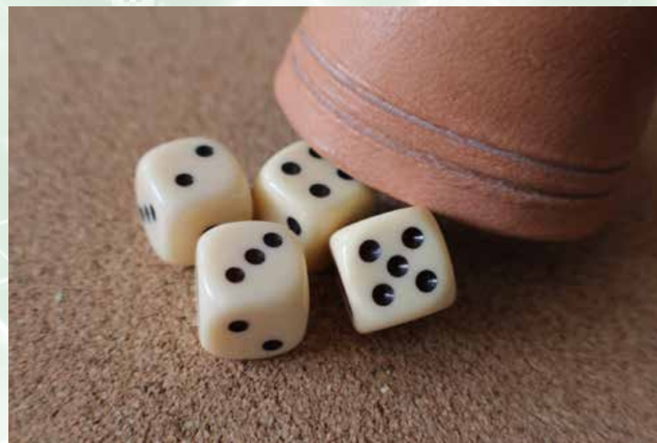
Kamera: Canon EOS 1300D, Blende F5.6, Brennweite 55mm bei 1/80 Sek

Interessierte sind jederzeit willkommen. Ansprechpartner ist Manfred Pollmann, Telefon 04944-806.