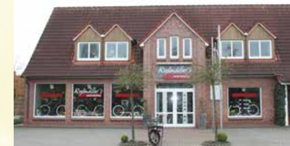
Der Verkaufsraum und das Geschäftshaus am Neuen Weg.

Ausführungen, von Kinderfahrrädern bis hin zum hochwertigen E-Bike hat der Kunde in diesem Zweiradshop die Wahl. Die Wünsche der Kunden rund ums Fahrrad „soweit wie möglich“ erfüllen, das liegt den Roßmüllers wie folgt am Herzen: