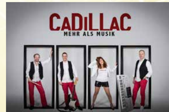
Sorgen am Freitag für Stimmung: Cadillac

BLUMENHALLE WIESMOOR 9. UND 10. MÄRZ VON 10 00 BIS 18 00 UHR