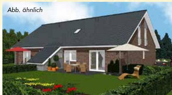
Geplante Doppelhäuser – Terrassenansicht

Bekanntlich besteht die Arbeitsgemeinschaft aus vier Wiesmoorer Maklerunternehmen; daher auch das Logo: