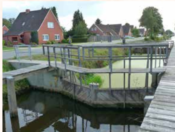
Schleuse Wilhelmsfehn I

Als Besonderheit sind noch die Aussparungen im Mauerwerk der Schleusen im Bereich der Schleusentore zu nennen (siehe Fotos). Hier kann mit Balkenlagen der Wasserstand gehalten werden, wenn die Schleusentore ausgebaut und gewartet werden müssen.