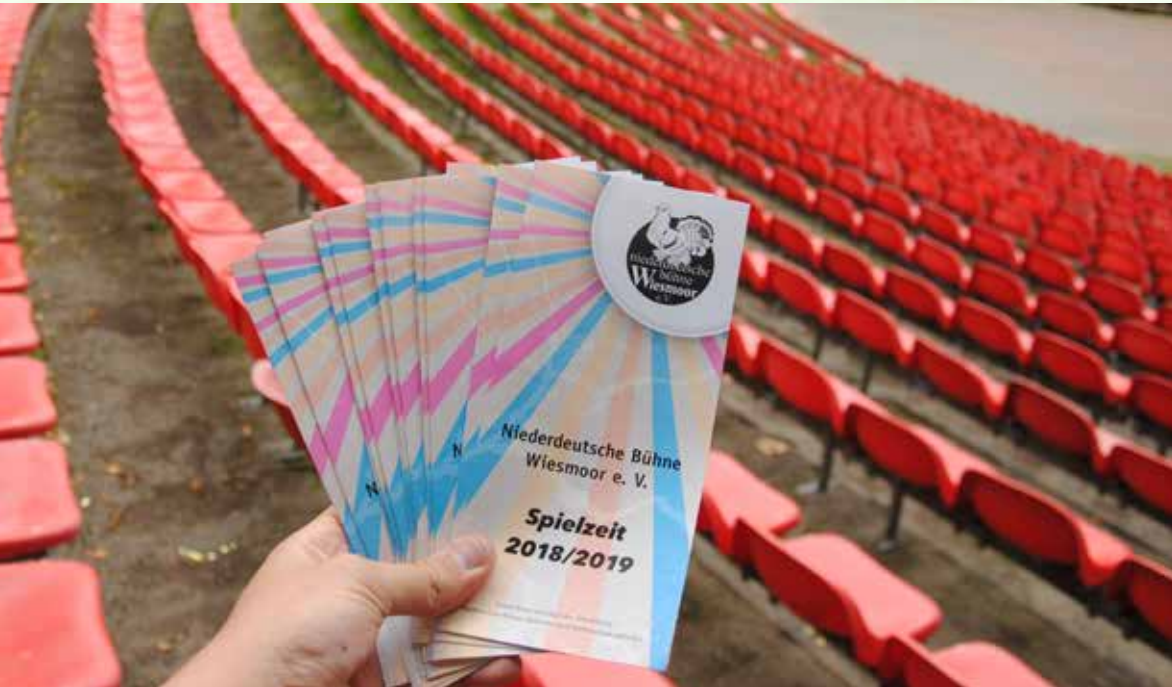
Die Spielzeitvorschau der Niederdeutschen Bühne ist in ganz Wiesmoor erhältlich. Im Hintergrund dieses Fotos ist die Freilichtbühne zu sehen. Dort wird im nächsten Sommer „Hexendrieven“ aufgeführt.

und 24. November. Die einzige Nachmittagsvorstellung findet am Sonntag, 18. November, um 15 Uhr statt. Karten können ab sofort bei der Touristik GmbH