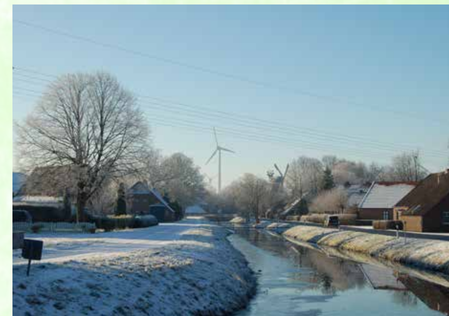
Ein winterliches Fehn-Motiv ziert den diesjährigen Adventskalender des Lions-Clubs.

aus dem Kalender sollen verschiedene Projekte mit den Schwerpunkten „Gewaltprävention“ (Klasse 2000), „Jugendarbeit“, „Kultur- und Heimatpflege“, die „Tafeln“ in Großefehn und Friedeburg unterstützt werden und zusätzlich wird damit die beliebte Weihnachtspäckchenaktion für die Region Friedeburg, Großefehn und Wiesmoor durchgeführt. Die Gewinn-Nummern werden wöchentlich im „Heimatblatt“ und im „Sonntagsblatt“ am 5.12.; 9.12.; 12.12.; 16.12., 19.12.; 23.12. und 30.12. veröffentlicht. Der Kalender ist ab dem 6.10.18 an ausgewählten Stellen im Stadtgebiet und in den