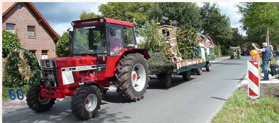
Ein Korsowagen des Festumzugs vom 68. Erntefest.