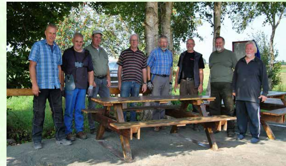
Dörpslüh beim Aufbau des Rastplatzes am Schafsweg und beim Pflastern des Pavillons.

nun Radfahrern und Wanderern die Möglichkeit, komfortabel mit viel Rundumsicht eine Rast einzulegen.