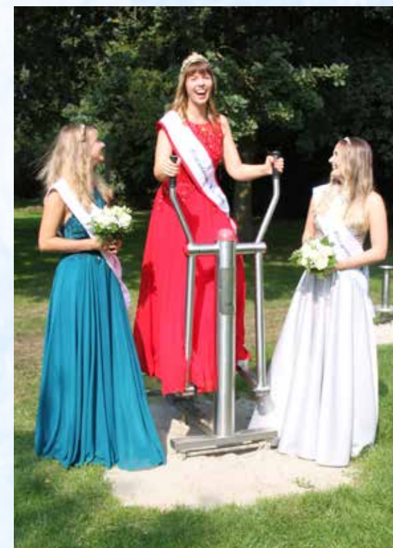
Mit der richtigen Motivation in die Amtszeit.