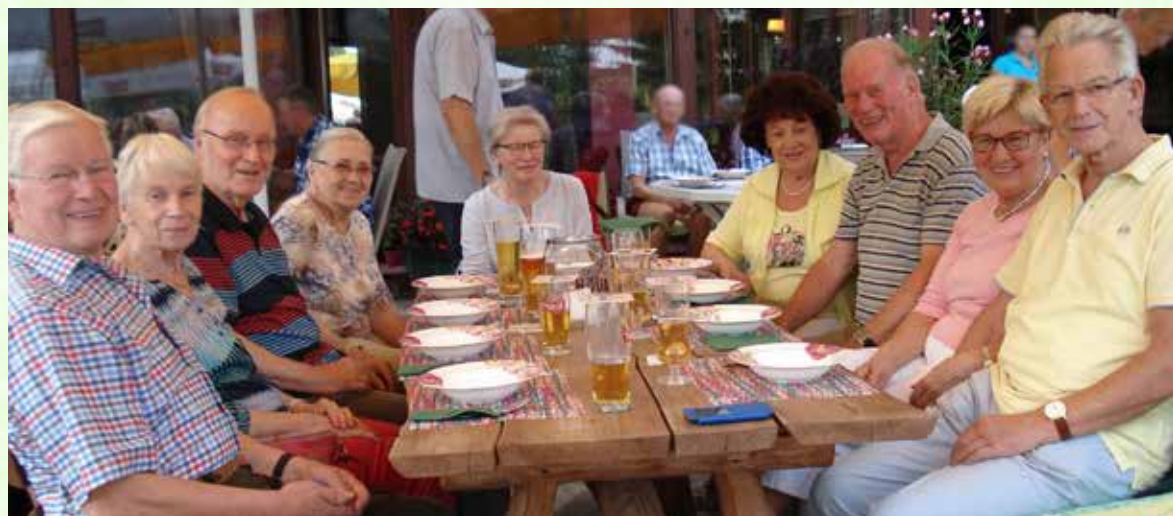
Eine rundum gelungene Jubiläumsfahrt in die Masurische Seenplatte erlebten die Mitglieder des Kegelclubs „Rote Kasse“.