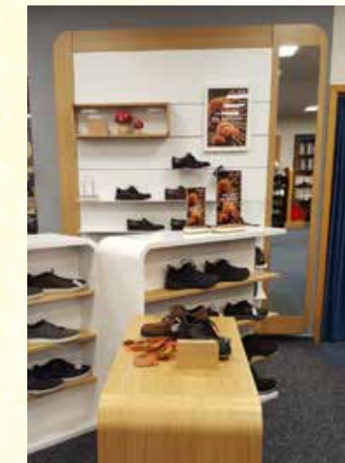
Das Schuhhaus Haltenhoff erscheint in neuem Glanz.