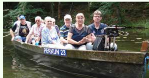
Kanufahrt auf dem Fluss Krutina.

Die Johannesburger Heide ist umgeben von dem größten Waldgebiet der Masuren. Ein Toperlebnis wurde eine Kahnfahrt auf dem Fluss Krutina, dem wohl längsten und schönsten der Flüsse Ostpreußens, der durch bezaubernde, oft parkähnliche Landschaften führt. Zum Abschluss kamen wir über Allenstein mit dem Schloss, dem Markt und der Pfarrkirche St. Jakob zurück.