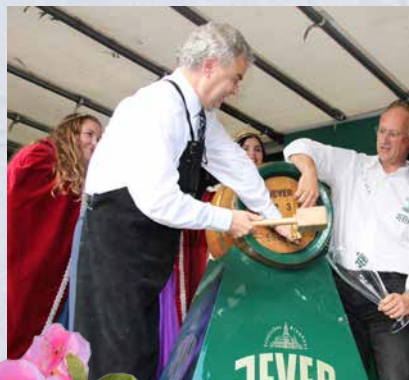
Eröffnung mit traditionellem Fassanstich.