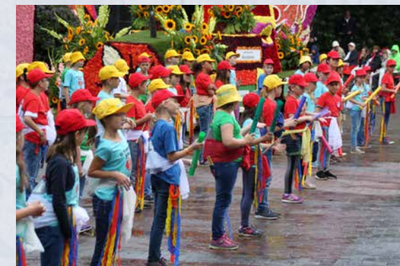
Tolle Aufführungen der Grundschulen und Kindergärten beim „Bunten Programm“ am Samstag.