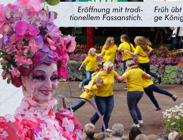
Die Volkstanzgruppe in Aktion.