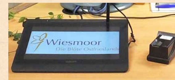
Wichtige Geräte bei der Abwicklung der täglichen Aufgaben: Signaturpad für digitale Unterschrift und der Fingerprinter für den digitalen Fingerabdruck.