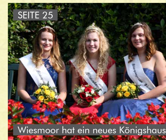
Wiesmoor hat ein neues Königshaus