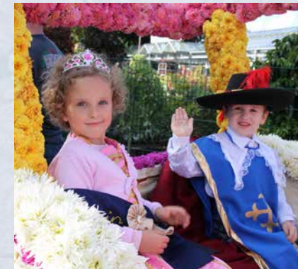
Früh übt sich das vielleicht zukünftige Königshaus.