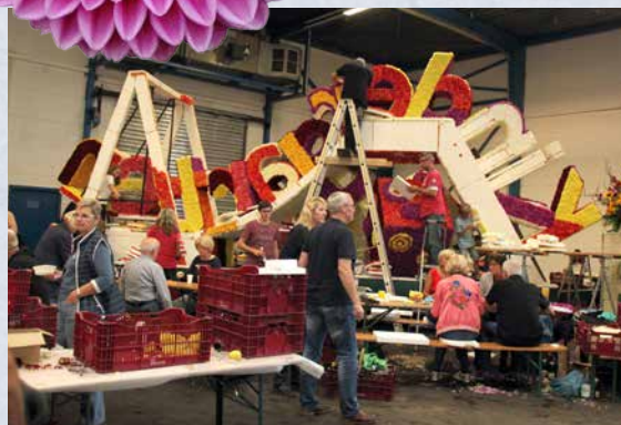
Kein Blütenfest ohne unzählige helfende Hände.