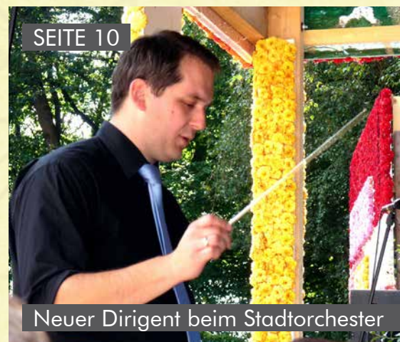
Neuer Dirigent beim Stadtorchester