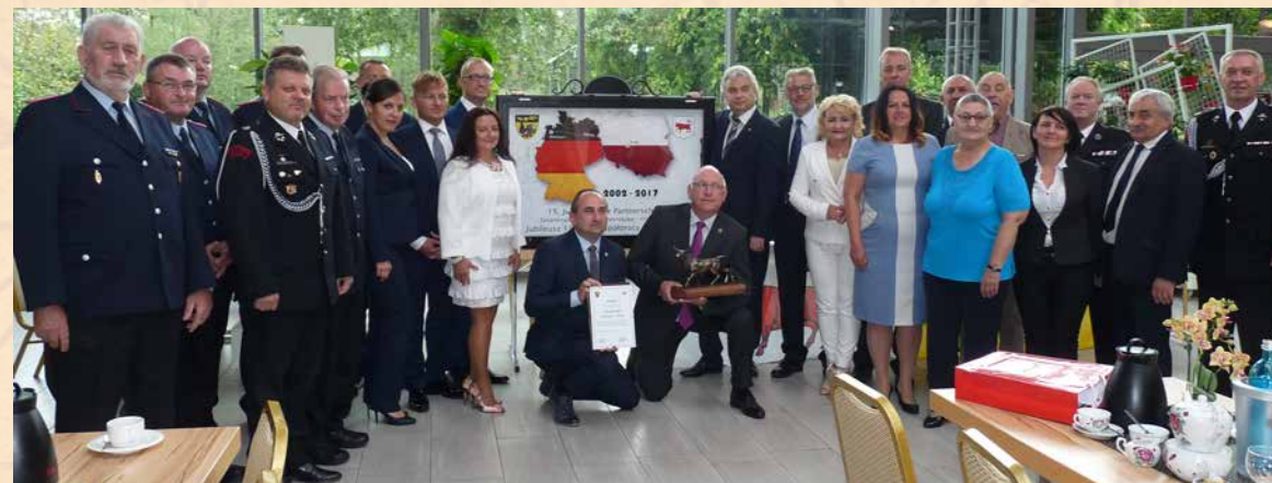
Die verschiedenen Gruppen aus beiden Städten versammelten sich um das die Partnerschaft symbolisierende Bild.