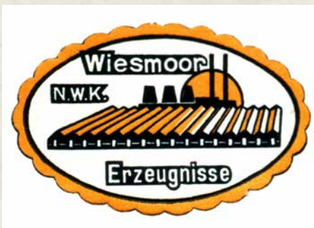
Mit diesem Logo wurden die Gärtnerei-Produkte vermarktet.

Das 1909 in Wiesmoor ans Netz gegangene Kraftwerk der Siemens Elektrischen Betriebe (SEB) war für die Stromerzeugung zuständig. Vertragsgemäß musste der Staat (Domänenfiskus) den dafür notwendigen Torf liefern. Bereits nach kurzer Zeit war die Torfproduktion unzureichend und ab 1914 musste zusätzlich Kohle mit verheizt werden. Durch das Fehlen von Arbeitskräften durch die Mobilmachung und dem in den Jahren 1914–1918 stattfindenden I. Weltkrieg verschlechterte sich die Situation zusätzlich und zum Schluss lag der Kohleanteil am Heizkraftstoff höher als der Torfanteil. Der Staat sah sich außer Stande, die vertraglich zugesicherten Torfmengen zu liefern. In den Jahren 1920/21 übernahmen die SEB die Torfgewinnung. Das war ein notwendiger und rettender Schritt. Statt das Torfkraftwerk abzuschreiben, konnte die Torfproduktion