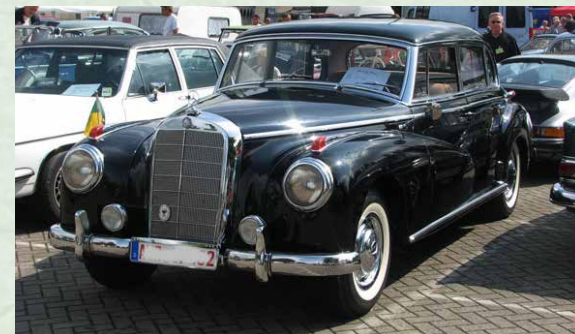
Mercedes Benz 300

viel Glück, was sie aber trotz verschiedener Regenschauer nicht davon abhielt, mit dem Oldtimer teilzunehmen, „dann muss das gute Stück eben anschließend einmal mehr geputzt werden“ und den Besuchern bot sich so manches „Benzin-Gespräch“ unter dem Regenschirm oder an den Ständen, die Leckeres für das leibliche Wohl bereit hielten.