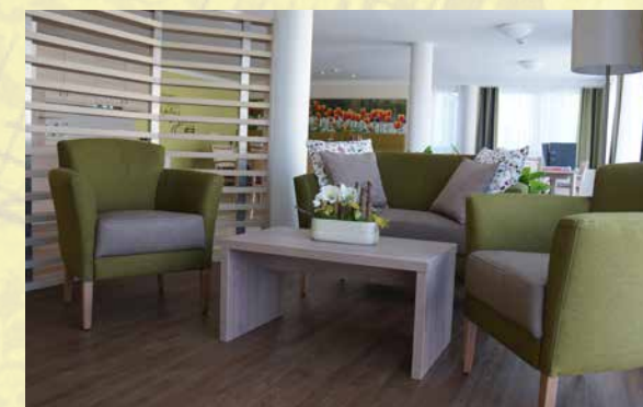
Freundliches Ambiente in der Seniorenresidenz Wiesmoor

In der hauseigenen Küche wird für die Bewohner täglich frisch gekocht und gebacken. Ein kompetentes Pflegeteam sorgt für eine professionelle Pflege, ergänzt wird es durch ein Betreuungsteam, um dadurch das Angebot der Tagesaktivitäten zu bereichern. Gemeinsam plant und gestaltet das Team den Alltag und die Arbeitsabläufe. Nach dem Motto „nur gemeinsam sind wir stark“ können sich interessierte Pflegekräfte bei der Seniorenresidenz bewerben, um sich hier in den einzelnen Arbeitsbereichen zu engagieren. Zum besseren Kennenlernen wird am 8. Oktober 2017 in der Zeit von 11 bis 17 Uhr ein „Tag der offenen Tür“ veranstaltet. An diesem