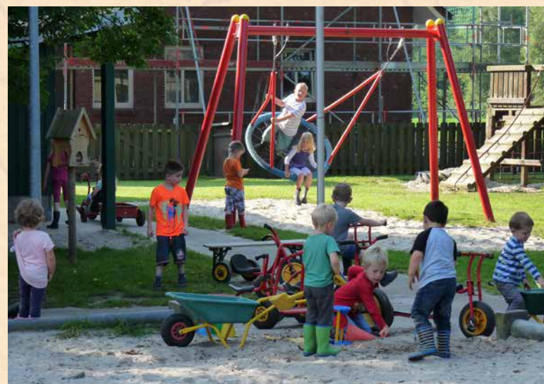
Der attraktive Außenbereich wird gerne von den Kindern genutzt.

„Im Kindergarten ‚Regenbogen‘, in unmittelbarer Nachbarschaft zur Christus-Gemeinde, werden den Kindern christliche Werte wie z.B. Vertrauen, Rücksichtnahme, Gemeinschaft und Liebe vermittelt. Unser Hintergrund ist dabei das Evangelium von Jesus Christus. Es ist die frohe Botschaft, die Kindern und Erwachsenen Mut zum Leben vermitteln will. Dies in alltäglichen Lebenszusammenhängen zu erfahren, dazu geben wir Hilfestellung (z.B. durch Einüben von Gebet; Singen von Liedern mit einem christlichen Hintergrund). Uns ist klar: Christlichen Glauben kann man nicht ‚verordnen‘. Darum wird bei uns keinem Kind etwas aufgezwungen! Aber wir wollen dazu beitragen, dass jedes Kind die Chance hat, in unserer Einrichtung etwas vom christlichen Glauben zu entdecken.“ (Aussage Website www. Kirche-spetz.de). Ein kleiner Andachtsraum macht dieses Anliegen sichtbar.