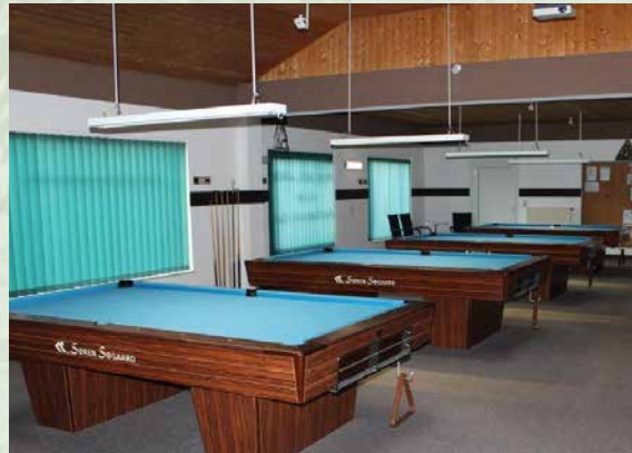
Die neu bezogenen Tische.

Am letzten Donnerstag im Monat findet bei uns im Vereinsheim ein Jackpot-Turnier statt.