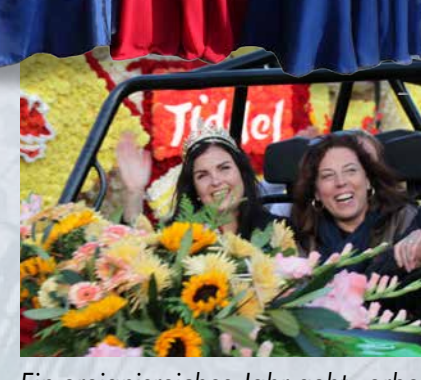
Ein ereignisreiches Jahr geht vorbei.