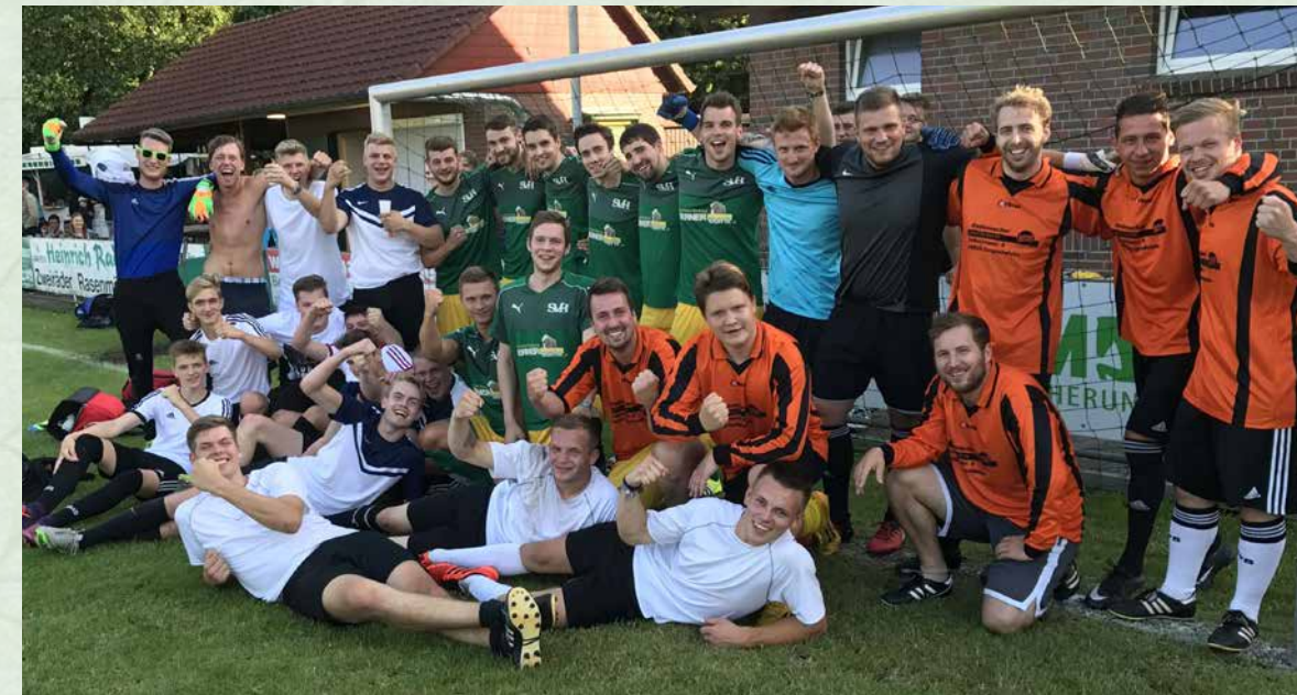
Halbfinalteams des Freizeitturniers.