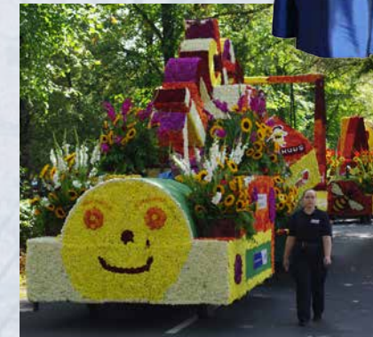
Bunter Korso am Sonntag.