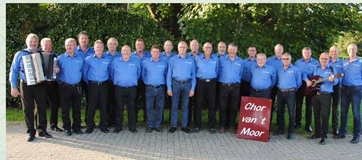
Die Sänger vom „Chor van`t Moor“ versammelten sich zum Jubiläumsfoto. Nicht alle Chor-Mitglieder konnten den Fototermin wahrnehmen.

hatten wir jedoch immer in der Werkstatt für behinderte Menschen, anlässlich deren Weihnachtsfeiern. Aber auch alle anderen Auftritte anlässlich von Hochzeiten, Geburts- tagen, Jubiläen, Vereinsfesten usw., hatten ihren besonderen Reiz. Das Jubiläum soll gemeinsam mit den Mullbarger Dörpmusikanten, die ebenfalls auf ein 20-jähriges Bestehen zurückblicken, entsprechend gefeiert werden.