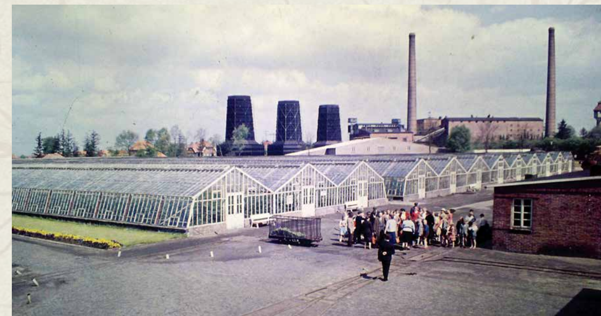
Das Bild (etwa 1960) zeigt eine Besuchergruppe vor den Tomatenhäusern, im Hintergrund die Champignonzucht und das Kraftwerk, vorne rechts das Packhaus.

die 145 Gewächshäuser mit dem Packhaus eine Fläche von 7,5 ha oder 30 Morgen (1961). Außerdem waren 1.200 m 2 Frühbeefenster vorhanden. Dem Gurkenanbau dienten rund 44.000 m 2 und dem Tomatenanbau 26.000 m 2 . Die restlichen 4.500 m 2 waren Verbindungs- und Anzuchthäuser. Hauptbauprodukte waren Tomaten und Gurken, später auch Melonen und nach dem II. Weltkrieg auch Champignons und Erdbeeren. Die Produkte wurden unter dem Markenzeichen Wiesmoor NWK-Erzeugnisse vertrieben und hatten wegen ihrer Qualität einen hervorragenden Ruf. Ein holländischer Gemüsegroßhändler versandte an seine Großkunden im März 1954 ein Rundschreiben: