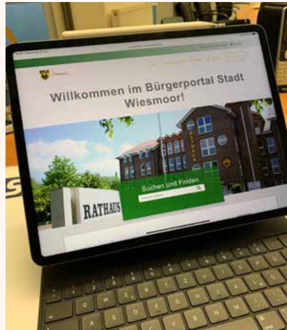
Das neue digitale Rathaus finden Sie unter: openrathaus.stadt-wiesmoor.de

bezahlt werden. Im eigenen Benutzerkonto können außerdem die „bestellten“ Dienstleistungen inklusive des Bearbeitungsstatus ein-