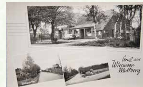
Eine Postkarte „Gruß aus Mullberg“ aus den 1960er Jahren.

Das Programm zum 100. Geburtstag bei der ehemaligen Schule im Birkhahnweg: Am Mittwoch, 25. Mai, findet um 19:00 Uhr ein „Bunter Abend“ als offizielle Eröffnung statt. Unter anderem tritt dann auch die Niederdeutsche