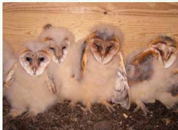
Junge Schleiereulen im Nistkasten.

Immer seltener wurden seinerzeit die Eulen gesichtet und viele Bestände drohten vollständig einzubrechen. Gefährdungsgründe gab es auch schon damals viele: Energie-sparmaßnahmen verschlossen Scheunen und Gebäude (Kirchen!), der Autoverkehr nahm deutlich zu (heute stirbt ein erheblicher Anteil der Jungen im ersten Lebensjahr als Verkehrsoffer), immer neue Wohnsiedlungen und Gewerbeflächen nahmen den Eulen überlebenswichtige Nahrungsflächen. Letztendlich begann mit der aufkommenden intensiven Landwirtschaft der zunehmende Pestizideinsatz und als Folge ausgeräumte, naturarme Landschaften. Mit den artenreichen Dauergrünlandflächen verschwanden auch die als Hauptbeute so wichtigen Mäuse. Heute bewirkt der zunehmende Maisanbau, dass immer mehr Grünlandflächen dauerhaft verlorengehen. Eine der ganz wichtigen Voraussetzungen für die Rettung der nachtaktiven, schon immer die Nähe der Menschen suchenden Eulen, wurden schnell