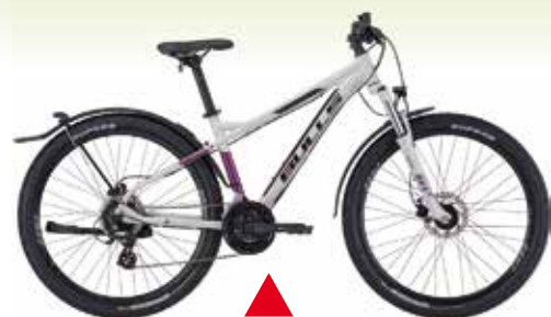
Bulls Zarena MTB mit Straßenausstattung

Von allen Marken mehrere Modelle in verschiedenen Größen, Rahmenformen und Farben vorrätig.