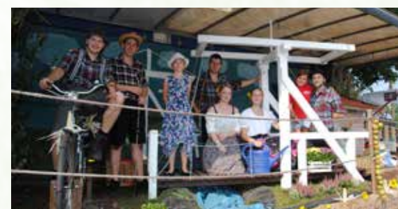
Der Erntekorso in Mullberg gehört zu den Höhepunkten des Jahres.

Der Ort entwickelte sich weiter. Die Wege wurden zunächst mit Flugplatzbrocken aus Marx und Horsten befestigt. Später folgten Asphalt und Beton. Es wurden Straßen ausgebaut und Eigenheime errichtet. In den 1980er Jahren begann man mit dem Bau der Kana-