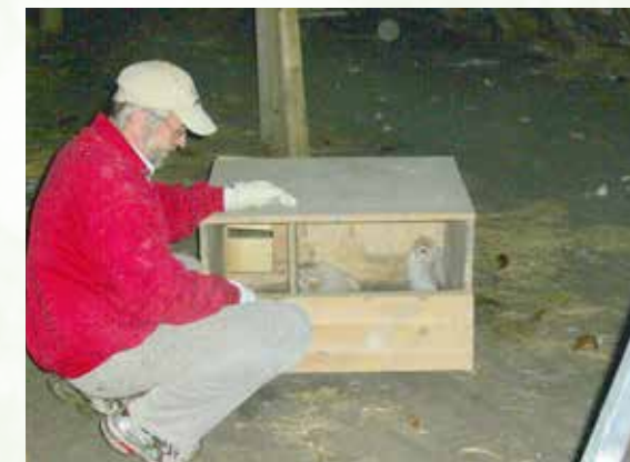
Reinigung und Wartung der Nistkästen.

Da helfen nur ausgeklügelte Strategien. So sind Schleiereulen durchaus in der Lage, derartige Verluste schnell durch eine hohe Geburtenrate (bis zu 9 Junge) in den darauffolgenden Jahren auszugleichen. Hält die Verfügbarkeit der Nahrung über einen