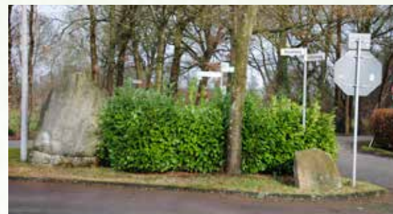
Ein Treffpunkt seit mehr als 90 Jahren: der „Dicke Stein“.

Um 1926 herum wurde eine einklassige Schule mit Lehrerwohnung gebaut. Bis zur Einweihung im Jahre 1927 mit Mullbergs