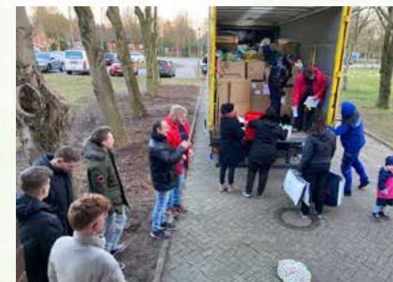
Spontane Hilfen machten die Aktion möglich.