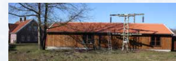
Die neue Halle.

Im Außenbereich lädt der Garten „Buuren-Tuun“ zum Verweilen ein. Hier wurde ein Gewächshaus aufgestellt und eine Kräuterspirale angelegt. Im Frühjahr werden hiesige Produkte gepflanzt und gesät, die die Kinder gerne probieren können. Und dann unser großes Projekt mit der neuen Halle.