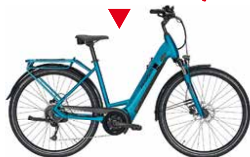
Gazelle Miss Grace