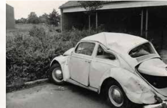
Mein damaliger Stolz, nachdem ich ihn mit Kameradenhilfe in die Kaserne schleppen konnte.

Geboren und aufgewachsen bin ich im westfälischen Werdohl – einer industriell geprägten Kleinstadt an den Ufern der Lenne. Schon in der Nachkriegszeit hatte die Stadt einen hervorragenden Personennahverkehr mit Kleinbahnen, später mit Bussen im Stadtgebiet, aber auch zu den Nachbarstädten Altena und Lüdenscheid, die teilweise halbstündlich, teilweise im Stundentakt fuhren. Für die Fahrten hatten wir eine Monatskarte und benötigten kein Auto. Das änderte sich erst im Verlauf des Militärdienstes, als ich 1967 meine jetzige Frau kennenlernte. Sie stammt aus Wiesmoor, ich war in der Wittmunder Richthofenkaserne stationiert. Ich war zum Sanitätssoldaten ausgebildet worden und diente in der dortigen Luftwaffen sanitätsstaffel. Um nicht immer auf motorisierte Kameraden angewiesen zu sein, machte ich meinen B-Führerschein in der Wittmunder Kfz-Staffel und kaufte mir im Jahr 1968 mein erstes Auto – einen weißen VW-Käfer mit 34 PS. Irgendwann – an das genaue Datum kann ich mich nicht mehr erinnern – klingelte kurz vor Dienstschluss das rote Alarmtelefon im Sanitätsbereich. Über das rote Telefon verbreitete der Tower wichtige Meldungen mittels Rundruf an alle angeschlossenen Telefone. Ein Flugunfall in Middels wurde gemeldet. Die Sanitätsbereitschaft auf dem Flugplatz rückte zusammen mit dem Fliegerarzt aus, ebenso auch weitere Krankenkraftwagen mit Sanitätspersonal der Kaserne, darunter auch ich. Die Bergung des zu Tode gekommenen Piloten dauerte recht lange und das Sani-