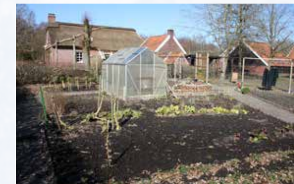
Der neue Gartenbereich.

60er Jahren. Wer noch Platten auf dem Boden hat, kann diese gerne dem Museum zur Verfügung stellen. Ganz besonders wird für Hochzeitspaare „Ganz in weiß“ von Roy Black gesucht.