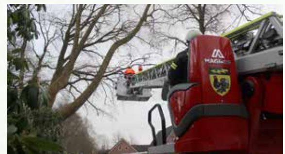
Gebrochene Äste stellten eine Gefahr dar und mussten entfernt werden.

denparkplatz eines Kaufhauses an der Hauptstraße. Durch den Sturm drohten dort zwei Parkboxen für Einkaufswagen aus ihrer Verankerung zu reißen. Als die Einsatzkräfte an einer der Parkboxen mit Sicherungsmaßnahmen beschäftigt waren, erfasste eine schwere Sturmböe den Unterstand und riss ihn über einen Meter in die Höhe. Ein Feuerwehrkamerad in unmittelbarer Nähe wurde dabei von der Konstruktion mitgerissen und zu Boden geschleudert. Dank der persönlichen