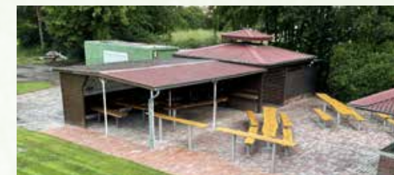
Die DG Wilhelmsfehn I freut sich über den neu gestalteten Grillplatz.

den. Selbstverständlich fanden die Arbeiten immer unter Einhaltung der Corona-Regeln statt. Von Oktober bis November wurde der Grillplatz in Angriff genommen. Die Steine wurden hochgenommen, Sand wurde aufgefüllt und die Steine neu eingesetzt. Auch hier waren viele Mitglieder der Dorfgemeinschaft fleißig vertreten. Im Juni 2021 konnten wir gemeinsam die Tische und Bänke streichen und anschließend auf dem Grillplatz montieren. Das Ergebnis kann sich sehen lassen und die Dorfgemeinschaft freut sich über einen neuen ansehnlichen Grillplatz.