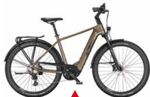
KTM Macina Gran 710