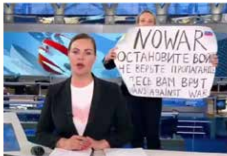
Ukraine-Protest im russ. Staatsfernsehen: Hut ab vor soviet Mut!!!!