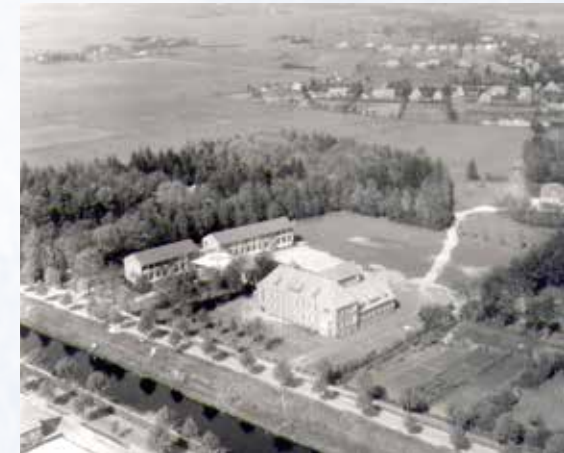
Mittel- und Volksschule etwa 1958.