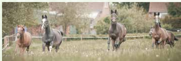
Pferde auf der Wiese.

Hygiene-Maßnahmen sind bei uns inzwischen zur Routine geworden – seit dem ersten Lockdown im März 2020 finden sie bei uns nach Rücksprache mit dem Gesundheitsamt Anwendung. Doch auch mit diesen Hygiene-Regeln und eines vom Max-Plank-Institut für Chemie errechneten sehr geringem Infektionsrisikos in Reithallen war Reitunterricht untersagt. Die Eingaben der Deutschen Reiterlichen Vereinigung zu den speziellen Gegebenheiten von Reitvereinen haben bei den Entscheidungsträgern leider kein Gehör gefunden. Nicht nur unsere Reitschüler machten lange