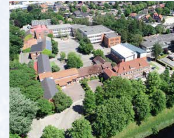
Der heutige Schulkomplex mit Grund- und Hauptschule sowie der KGS.

wertvoll ergänzt werden. Um ein großes Gebiet des neuen Buches ein wenig zu beleuchten, erscheint heute ein Beispiel in Form von zwei Luftaufnahmen. Die Schwarzweiß-Aufnahme der Mittel- und Volksschule entstand etwa 1958. Die Farbaufnahme zeigt den Schulkomplex von heute. Ähnliche Gegenüberstellungen sind geplant. Die Bilder werden jeweils fast ganzseitig dargestellt.