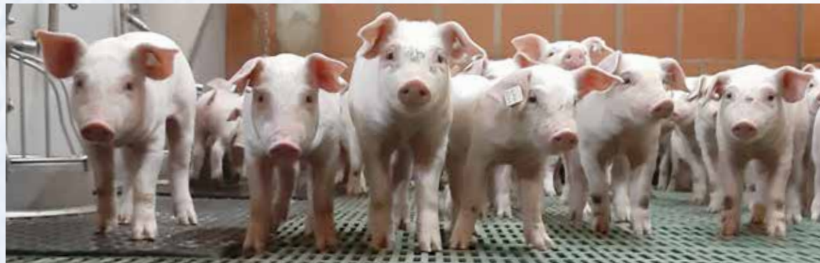
Die kleinen Ferkel sind ca. 5 Wochen alt.

Leben. Den Tieren wird dabei in modernen, großen Ställen viel Platz geboten. Uns liegt das Wohl der Tiere am Herzen – deswegen nehmen wir seit 2018 an der „Initiative Tierwohl“ teil und konnten in der Neuauflage 2021 den gesamten Betrieb zertifizieren. Dabei werden die Vorgaben – wie mehr Platz, mehr Tageslicht, Spielmaterial oder das Angebot von Raufutter wie Heu und Stroh – meist übertroffen. Bei der Arbeit mit den Schweinen werden wir durch unseren Mitarbeiter unterstützt. Den Arbeitsschwerpunkt stellt hierbei die Geburt der Ferkel dar. Einmal monatlich werden auf