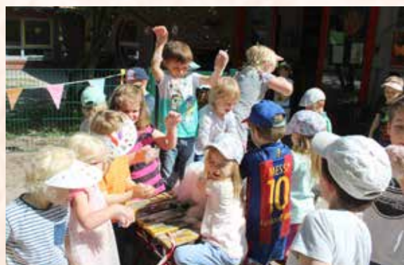
Fröhliche Kinder auf dem Kinderfest.

Schon das Jubiläum zum 25-jährigen Bestehen unserer Kita im vergangenen Jahr musste aufgrund der Corona-Pandemie ausfallen, ebenso das Martinifest, die Weihnachts- und die Faschingsfeier. Ein Maibaumfest konnte in diesem Jahr nur im kleinen Rahmen gefeiert werden – alles in allem gab es für Kinder und Erzieher und Erzieherinnen seit Beginn der Pandemie nicht viel Erfreuliches zu erleben.