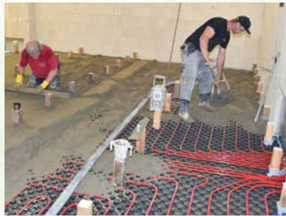
Im ehemaligen Hallentrakt, der zum Theater umgebaut wird, wurden Anfang Juli die Estricharbeiten verrichtet. Die Estrichfirma Rozman leistete ganze Arbeit.

Der Name der künftigen Kulturstätte an der Hauptstraße stadtauswärts in Richtung Voßbarg sollte möglichst in plattdeutscher Sprache und nicht zu lang sein. Wer einen entsprechenden Vorschlag hat, der sendet diesen bitte bis zum 31.08.2021 an: wiesmoor.ndb@gmail.com (neben dem Theaternamen sollten der vollständige Name und die Anschrift des Einsenders mit aufgeführt werden). Der Vorstand wird dann entscheiden, welcher Name der beste ist. Es gibt