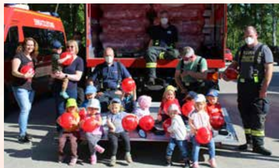
Die Feuerwehr zu Besuch.

Als die Zahlen nun immer weiter rückläufig waren, reifte im Team der Kita Regenbogensteppkes die Idee, zum „Internationalen Kindertag“ ein Fest für die Kinder aus allen drei Gruppen zu organisieren, das natürlich berücksichtigte, dass eine Durchmischung der Gruppen immer noch nicht stattfinden durfte. Eine Teamkollegin fragte bei verschiedenen Wiesmoorer Firmen, bei der Krankenkasse und der Feuerwehr nach, wer uns zu diesem Fest ein paar Preise für die Kinder zur Verfügung stellen könnte. Die Resonanz auf diese Anfrage übertraf einfach all unsere Erwartungen!!! Es ging den Spendern wohl äh-