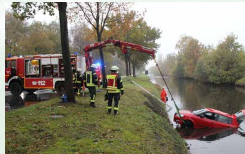
Schreck in der Morgenstunde...

ren des Fahrzeugs von außen zunächst nicht öffnen ließen, musste er eine Seitenscheibe einschlagen. Danach gelang es ihm, beide Personen aus dem Pkw zu befreien. Weitere Ersthelfer kümmerten sich im Anschluss um die Unfallbeteiligten. Da zum Zeitpunkt der Alarmierung der Rettungskräfte, um 07.38 Uhr, davon ausgegangen werden musste, dass sich die Personen noch im versunkenen Fahrzeug befanden, rückte ein Großaufgebot von Feuerwehr, Rettungsdienst, DLRG und Polizei zur Unfallstelle aus. Doch nachdem die zahlreichen Einsatzkräfte die Einsatzstelle erreicht hatten, konnte schließlich schnell Entwarnung gegeben werden. Die drei Unfallbeteiligten trugen glücklicherweise keine schwereren Verletzungen davon. Der junge Ersthelfer, der das ältere Ehepaar aus dem Pkw befreite, verletzte sich bei der Rettungsaktion leicht an einer Hand. Sie alle wurden durch die Mitarbeiter des Rettungsdienstes versorgt. Die Feuerwehr sicherte die Unfallstelle ab und hob das Unfallfahrzeug nach Abschluss der Unfallaufnahme durch die Polizei mit dem Kran des Rüstwagens aus dem Kanal. Nach gut 90 Minuten konnten die letzten Kräfte die Einsatzstelle wieder verlassen.