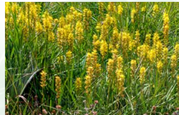
Bestände der Moorlilie.

W ährend Spaziergänger oder Fahrradfahrer sich vielleicht noch über die grünen Flächen rundum Wiesmoor freuen, sieht unsereins weite Teile der Landschaft eher mit gemischten Gefühlen. War es vor 20 Jahren noch relativ einfach, eine interessante Exkursion für Naturinteressierte in Wiesmoor und Umgebung anzubie-