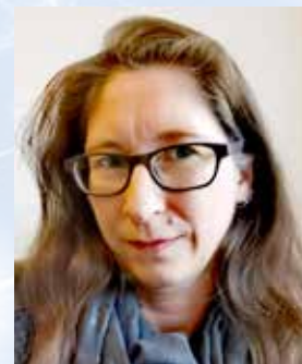
Birgit de Wall: Layout, DTP

aber doch eine gehörige Portion Elan und Zuversicht aller Beteiligten. In nur vier Wochen von Null auf Hundert? Ja, dieser enge Zeitraum reichte aus, von der Vorstellung des End-Layouts (es wurde einstimmig angenommen), im Hause des Verlages Print Media, bis zur Auslieferung.