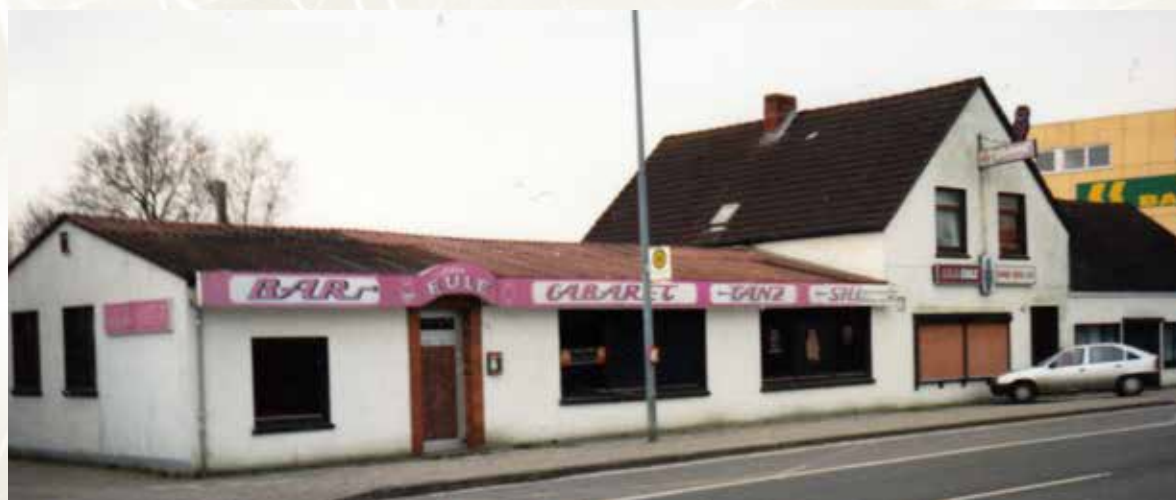
Die „Lila Eule“ in Wiesmoor, an der Hauptstraße, kurz vor dem Abriss im Jahr 1988.

der Gedanke, wir fahren nach Wiesmoor zur „Lila Eule“, einem Nachtlokal mit Striptease und Programm. Dort waren wir noch nie gewesen und die „Lila Eule“ hatte in ganz Deutschland einen sehr guten Ruf, was das Programm mit sehr viel nackter Haut auf der Bühne anging.