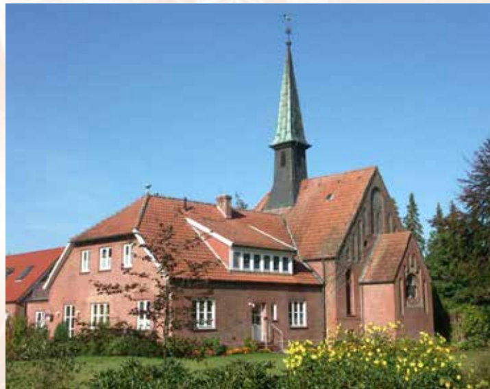
Ev. Kreuzkirche in Marcardsmoor