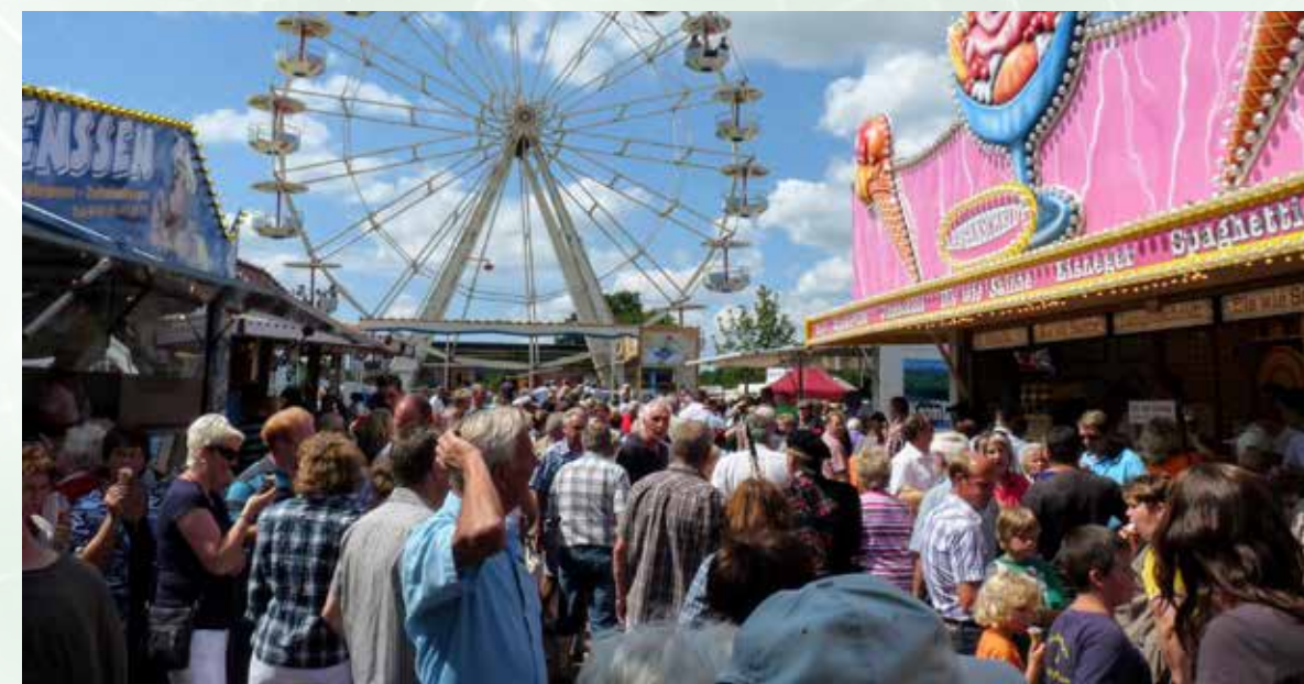
Festgelände mit Riesenrad.