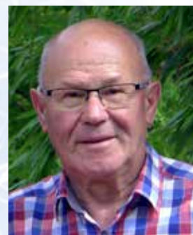
Ewald Hennek: Historie, Korrektur, Schluss-Revision