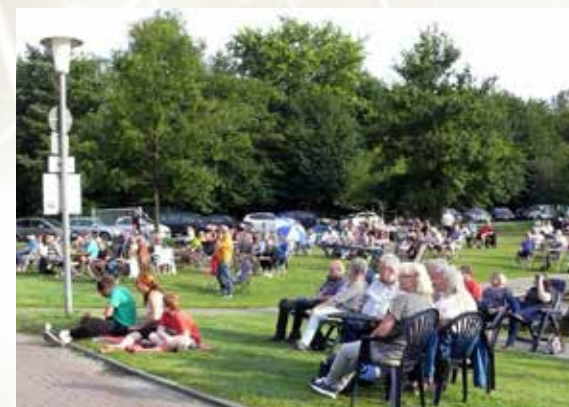
Gartenstuhlkonzert am „Lüttje Haven“.

erschutz neben dem Industriegelände (Fa. Bohlen & Doyen und andere) wurde zu einem Hafenbecken umgestaltet und mittels eines Stichkanals mit dem Ottermeer verbunden. Im südlichen Bereich des Ottermeeres wurde eine kleine Insel belassen, die als Vogelschutzzone dienen sollte.