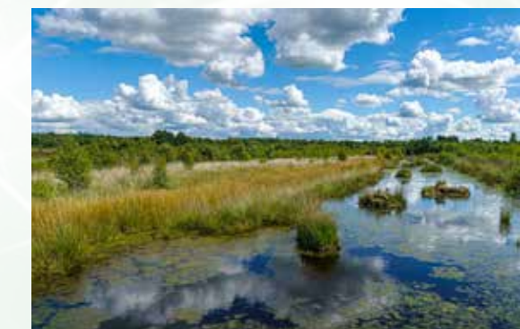
Der in 2018 neu gebaggerten Damm.

gleichen Namens) war ein ehemaliger Hochmoorsee, der noch um 1800 eine offene Wasserfläche von 10 ha aufwies, inzwischen aber fast völlig verlandet ist. Die Entstehung dürfte vor ca. 6000 Jahren durch hohe Niederschläge und eine stark verdichtende, wasserstauende Schicht (Ortstein) begonnen haben. Ältere Einwohner Wiesmoors verbinden mit dem Begriff „Ottermeer“ meistens ein gefährliches Sumpfgebiet, in dem es