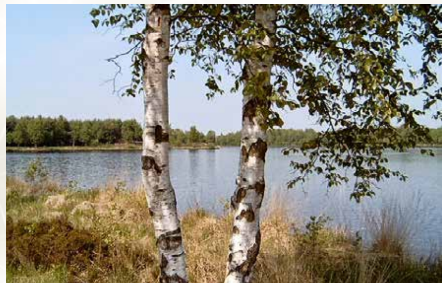
Natur pur am Ottermeer.

Während der Baggerarbeiten gab es im Sommer 1974 einen Zwischenfall. Ein Dammbruch führte dazu, dass größere Wassermengen aus dem See ausliefen und Rich-