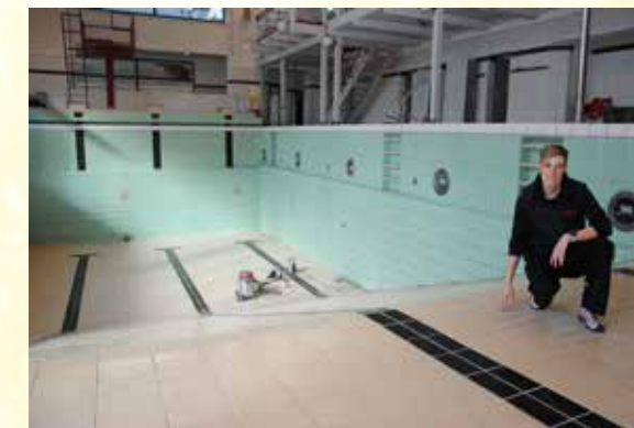
Bademeisterin Britta Lampen überprüfte das große Schwimmbecken auf Schadstellen.

im gemäßigten Tempo, um eine Überlastung des Klärwerkes zu vermeiden. Vor dem Ein-