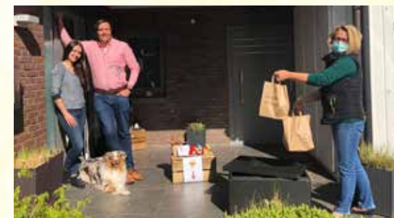
Zu Hause leckeres Eis genießen.

Die Bestellungen können per Mail oder über WhatsApp aufgegeben werden und werden an bestimmten Tagen zwischen 14 und 18 Uhr kontaktlos nach Hause geliefert. Der Mindestbestellwert beträgt 15 Euro. Darüber hinaus ist eine Selbstabholung möglich – aus Hygienevor-