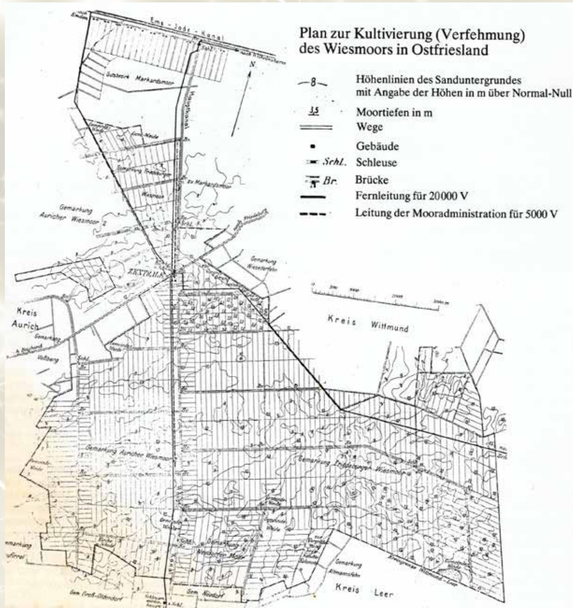
Verfehmung des Wiesmoors