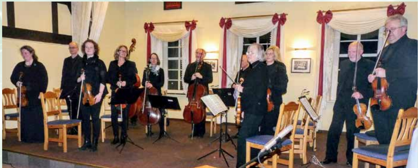
Das Ostfriesische Kammerorchester begeisterte sein Publikum in Wiesmoor.

nach einer Zugabe spendete das Publikum stehend reichlich Applaus. Markus Zöbelein bedankte sich bei der Sparkasse Aurich-Norden für die finanzielle Unterstützung und überreichte allen Mitwirkenden als Zeichen des Dankes eine Rose.