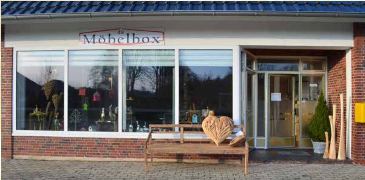
In der Möbelbox gibt es Kreatives zu entdecken.

Die Möbelbox ist dienstags und donnerstags von 9.30 bis 12.00 Uhr und freitags von 15.30 bis 18.00 Uhr geöffnet. Inka Hausmann bietet ebenfalls in ihrem Onlineshop „diemoebelbox.de“ eine große Auswahl und hier kann rund um die Uhr gestöbert und eingekauft werden.