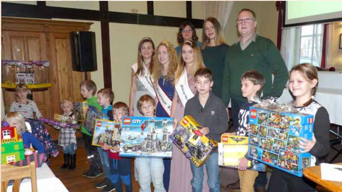
Eine gelungene Veranstaltung fand mit der Preisverleihung seinen „krönenden“ Abschluss.

Die Preisträger erhielten aus den Händen des Wiesmoorer Königshauses ihre wohlverdienten Preise.