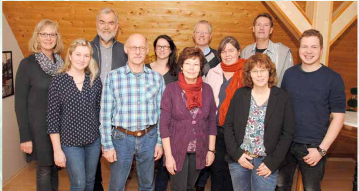
Das Ensemble von „Jonny's letzte Botterfohrt“ hat mit den Proben begonnen.

Telefonische Kartenreservierungen nimmt die Touristik GmbH unter 04944 / 91980 entgegen.