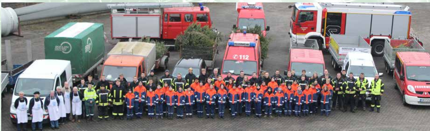
Die fleißigen Helfer der Weihnachtsbaumaktion.

Ein weiterer besonderer Dank geht an die Firmen und Unternehmer, welche die beiden Mahlzeiten sponserten (Bäckerei Behmann, Geflügelhof Schmidt) und natürlich auch an die Firmen, die freundlicherweise Fahrzeuge für die Sammelaktion zur Verfügung gestellt haben (Kaufhaus Behrends, Bohlen & Doyen, Schoon Mietpark, Post Bauunternehmen, TBD, Gahl Land- und Hoftechnik, Jens Lubinus Anhängerleih und Kleintransporte, Baubetriebshof der Stadt Wiesmoor).